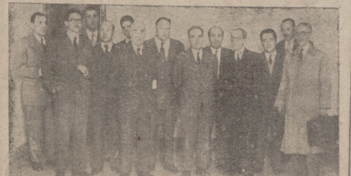
Consejo Asesor de la Delegación Provincial del Instituto Nacional de Previsión