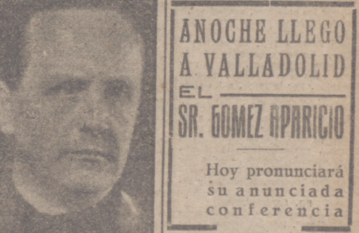
HABLA SANZ ORRIO

"Crear un Ejército de un millón de hombres es un plan para salvar a Europa" (ACHESON)