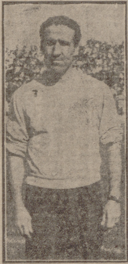
Futbol, entusiasmo y velocidad. —Pues todo eso no le falta al Valladolid, de modo que habrá lucha.

—¿Armas secretas, entonces? —Herrera ríe y enseguida añade: —Nada de armas secretas.