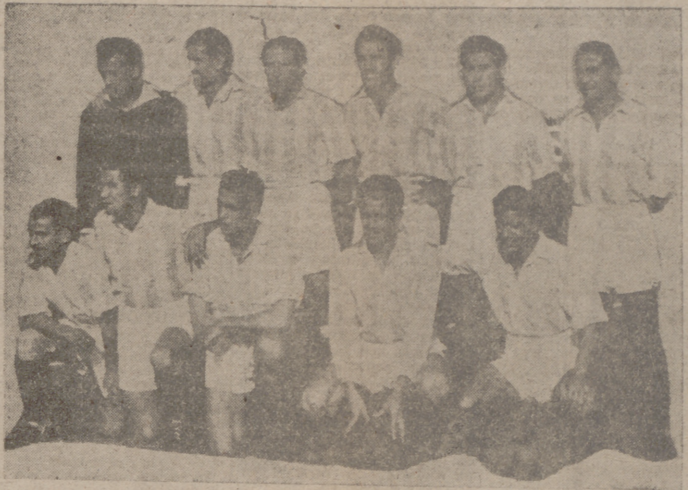
He aquí los once fenómenos designados por Ipiña para conquistar los dos puntos que se disputan esta tarde. Los triunfadores de San Mamés recibirán hoy la ovación que se merecen y después a ganar, que ya es hora de acabar con el "mito" del Atlético. — Saso, Lesmes I, Babot, Lesmes II, Ortega, Lasala, Tatono, Coque, Munne, Aldecoa y Pepin, a quien ustedes ven aquí, tienen la palabra.