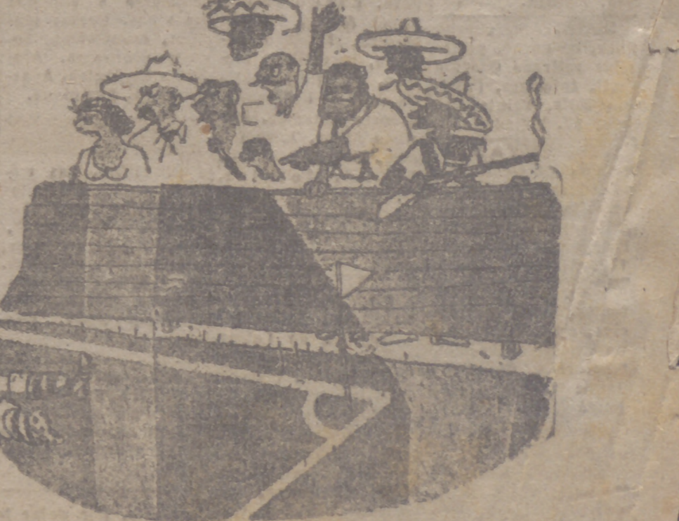
—Sólo quedan dos delanteros, un defensa y un medio. Esto va estupendamente.