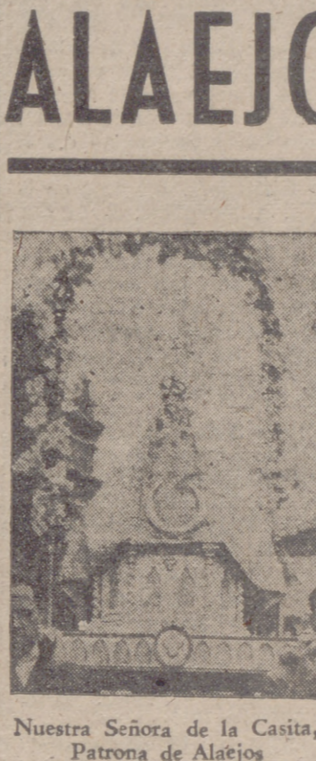
Nuestra Señora de la Casita, Patrona de Alaejos