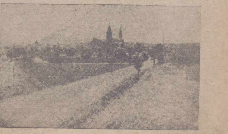
Vista parcial de Alaejos

Un huevo de gallina de 125 gramos Sevilla, 6. — Un huevo que pesó 125 gramos ha puesto una gallina, propiedad de don Wenceslao Delgado Torre, en el pueblo de Cala.—Cifra.