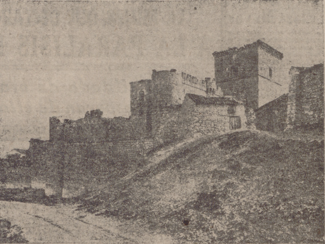
Sobre uno de tantos altozanos como jalonan la llanura de Castilla, se yergue altivo, símbolo de grandezas pasadas, un Castillo señorial. A su lado vive feliz, en sus recuerdos y de sus trabajos, una Villa. En la falda de la cuesta, como sirviendo de sostén y ayuda a aquella, otro pueblo industrial y afanoso, Arrabal.

Una Comunidad de Villa y Tierra, se enfrenta con los pueblos comarceros; sólo uno, Reoyo, permanece fiel y le ayuda, y la Villa, agradecida, se le anexiona y la da el nombre de Arrabal de Portillo.