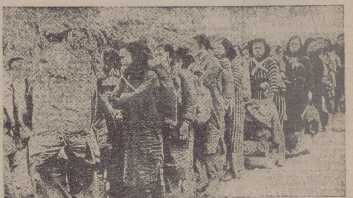
Entre los graves problemas planteados a Formosa, figura en primer lugar el exceso de población, provocado por los desplazamientos en masa ante el avance comunista. He aquí un grupo de mujeres chinas esperando la autorización necesaria para pasar al último bastión nacionalista.

"How do you do", generalísimo, es usted muy amable en venir a recibirme —ha dicho el general Mac Arthur al dar la mañana a Chiang-Kai-Chek, hace pocos días, en el aeródromo de Taipei, en Formosa. Chiang-Kai-Chek y Mac Arthur colaboran estrechamente desde hace mucho en el orden militar, pero el encuentro de Taipei ha sido su primer contacto personal. Las declaraciones hechas en tales circunstancias demuestran que el futuro de China nacionalista está ahora ligado al de Estados Unidos. Esta vuelta de la política yanqui es, desde luego, el acontecimiento más notable, con el ataque soviético a Corea, de la época turbia que vivimos. Sólo hace pocos meses que el presidente Truman declaraba que los Estados de la Unión no concertarían ninguna ayuda militar con los nacionalistas chinos. El secretario de Estado, Mr. Dean Acheson, preconizaba una política aún más extraña. Pensaba que el mejor modo de inculcar a los pueblos asiáticos el odio de los soviets era dejar las manos libres a Moscú. El ataque contra Corea ha impulsado a Truman y a Acheson a modificar enteramente sus concepciones.