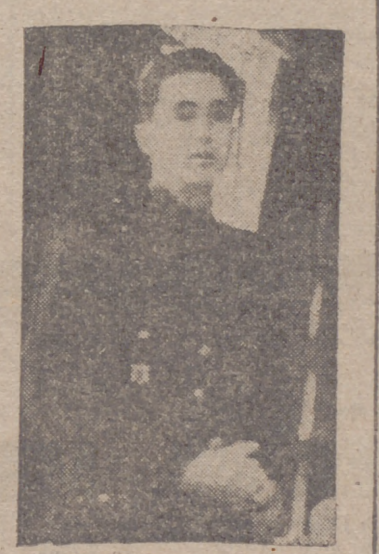
(INFORMACION EN LA PAGINA TERCERA.)

En Navia (Asturias), víctima de un desgraciado accidente