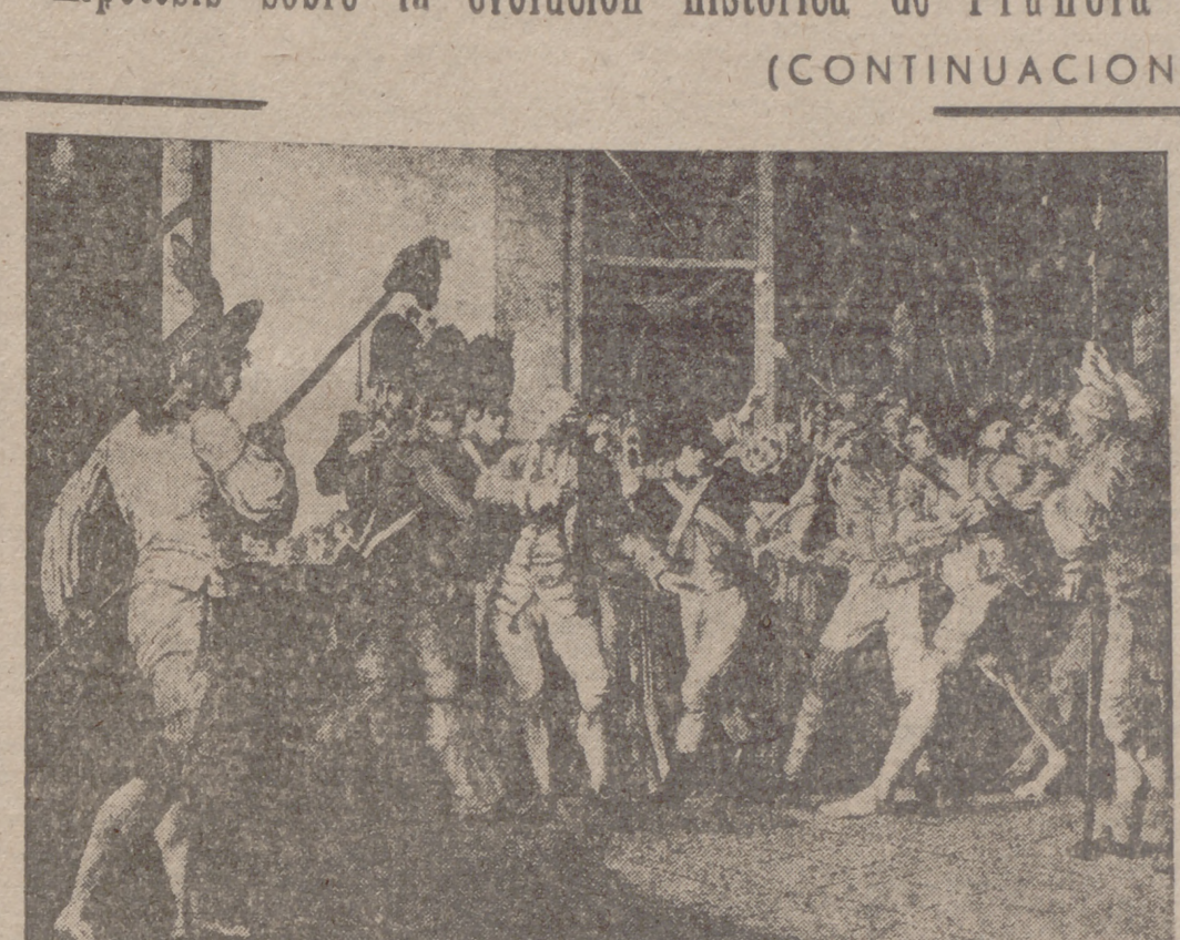
Las turbas entran en Versailles y obligan a Luis XVI a ponerse el gorro frigio (De un grabado de la época.)