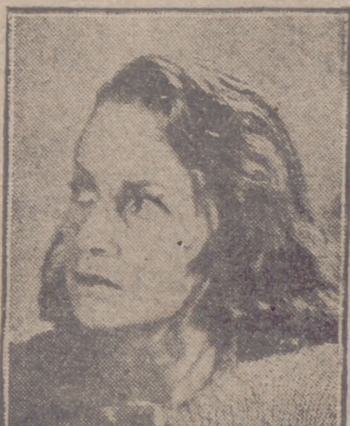
OLIVIA DE HAVILLAND

Praga.—Las películas rusas se han llevado todos los principales premios en el festival internacional