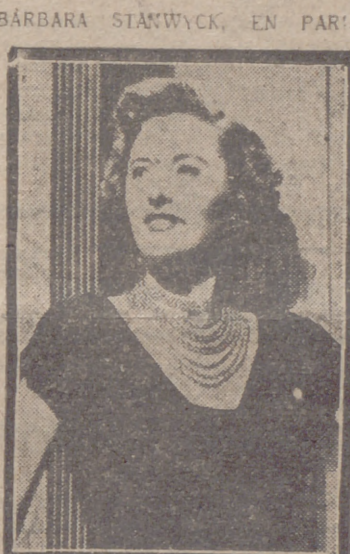
BARBARA STANWYCK, EN PARÍS