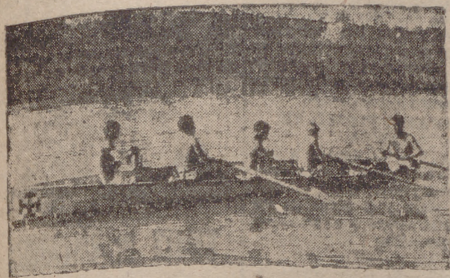
En el plan de estudios organizado por nuestra Universidad se prevén actividades deportivas complementarias. He aquí a nuestros remeros universitarios durante una competición en el Pisuerga.

Se celebrarán este verano en la capital del distrito y en San Sebastián