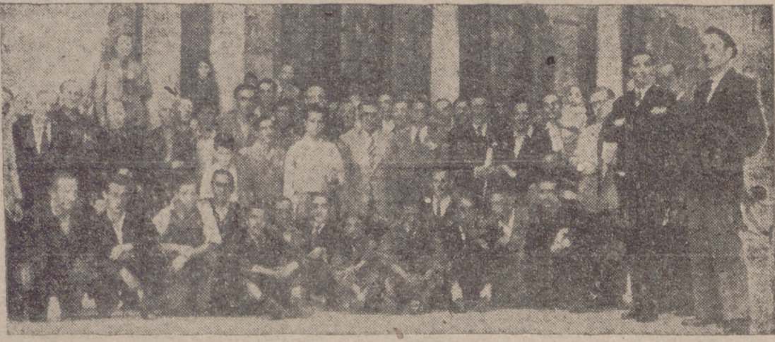
Un grupo de productores del Sindicato de Actividades Diversas a la salida de la iglesia del Salvador, donde se celebró una misa en honor de su Patrona.