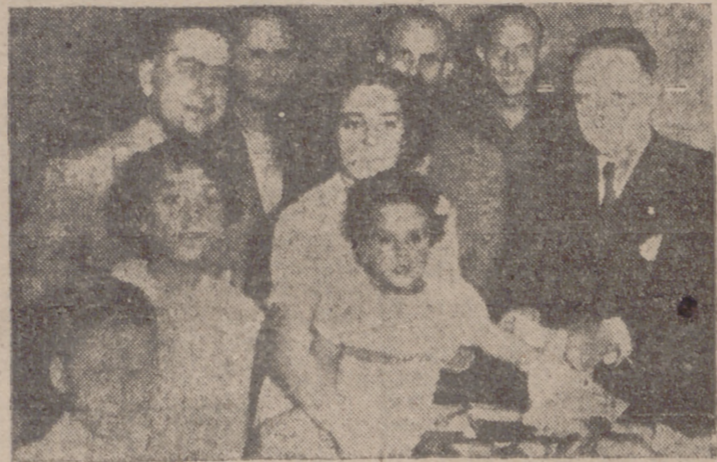
Momento en que un pequeño, asistente al sorteo, extrae el número premiado.