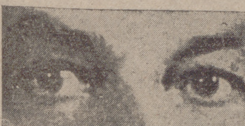
Los ojos, reflejo del carácter y del estado físico.

De entre las preocupaciones humanas, acaso una de las más obsesivas haya sido siempre la de descubrir el interior de los hombres por sus manifestaciones exteriores. El hombre ha intentado leer, o que le leyeran, a través de los rasgos de su cara («la cara es el espejo del alma»), a través de las líneas de su mano, e incluso a través de las líneas de su pluma, que dieron lugar a esa ciencia de la grafología, de la que tantas aplicaciones se han hecho.