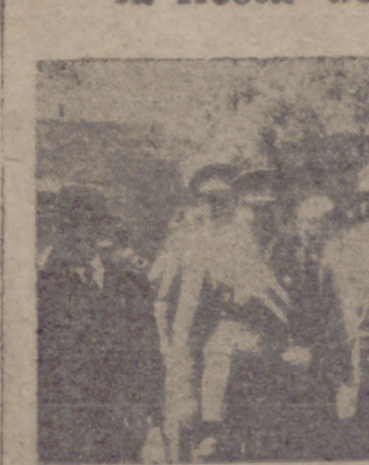
Autoridades que presidieron los actos