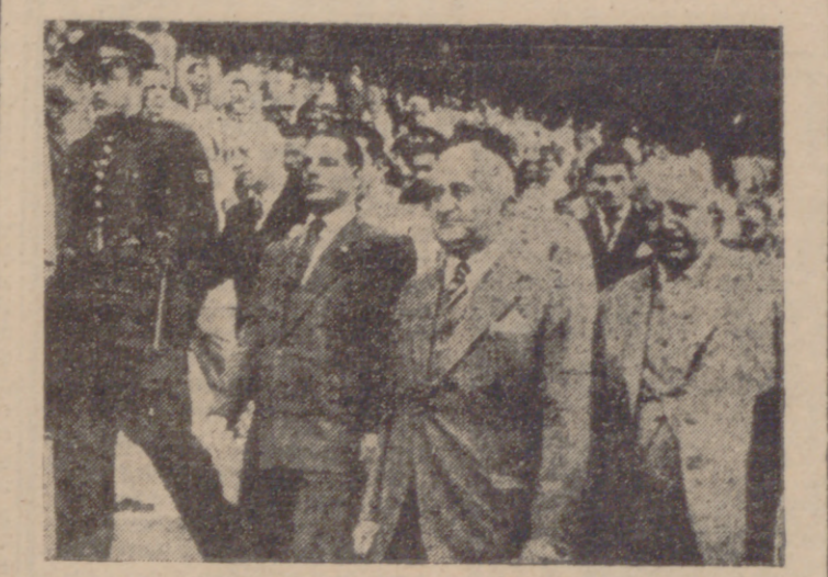
Rio de Janeiro.—El presidente de la República, señor Dutra, acompañado del prefecto del Distrito Federal, señor Mendes de Moraes, y varias autoridades, recorriendo el Estadio Municipal con motivo de su inauguración.