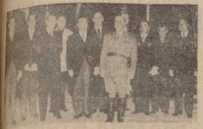
Madrid.—Su Excelencia el Jefe del Estado con los miembros de la Comisión del Servicio Nacional del Esparto, presidida por el jefe del mismo, a los que recibió en audiencia en el Palacio de El Pardo.

La XIV promoción de Infantería, a la que pertenece el Jefe del Estado, conmemoró el XL aniversario de su salida de la Academia