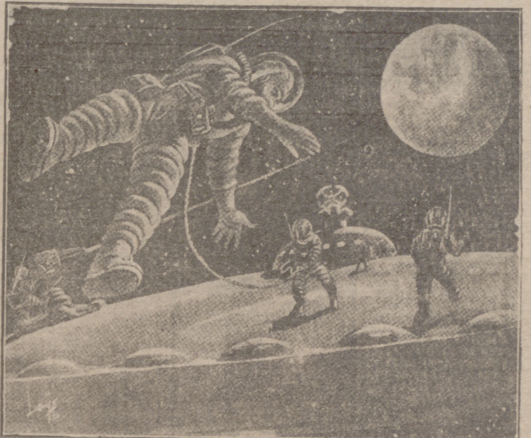
He aquí una visión fantástica de lo que podría ser el montaje de una "isla interplanetaria", donde los hombres se mueven metidos en sus escafandras para asentar, a 34.000 kilómetros de la Tierra, los mojones de la conquista del espacio.

¿Nos llevará la idea de Forrestal a la realidad de turistas del Espacio?