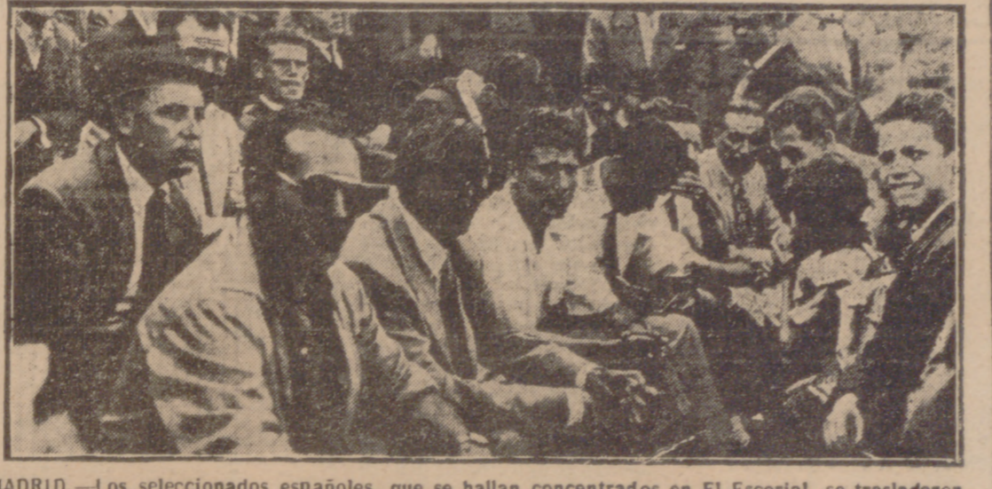
MADRID.—Los seleccionados españoles, que se hallan concentrados en El Escorial, se trasladaron a Madrid para presenciar el partido entre el equipo titular de esta ciudad y el conjunto húngaro Hungría, integrado por futbolistas exiliados de su Patria.