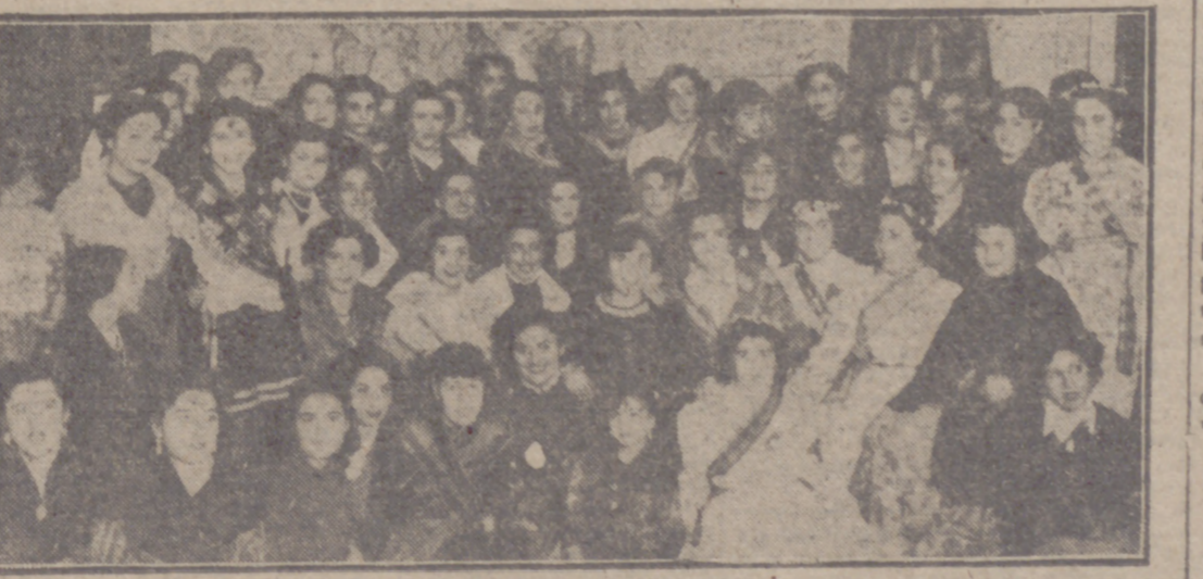
El alcalde la ciudad con las mozas labradoras que han sido invitadas al XIII Concurso de Arada, que se celebrará esta tarde. (INFORMACION EN PAGINA CUARTA)