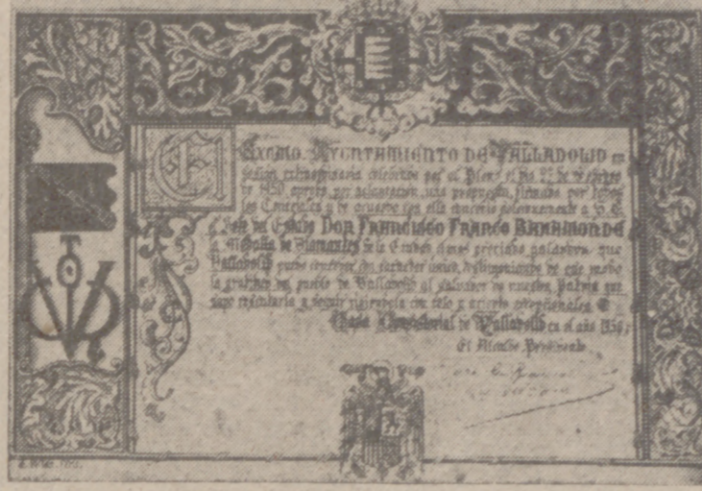
El pergamino en el que consta el acuerdo de la concesión