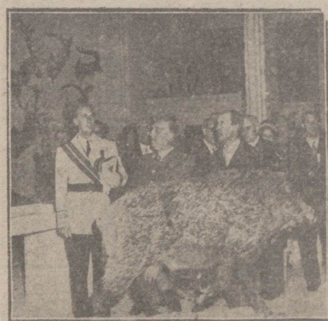
MADRID.—Su Excelencia el Jefe del Estado durante su visita al Museo de Arte Moderno, donde inauguró la Exposición de Trofeos Venatorios y de la Caza en el Arte.