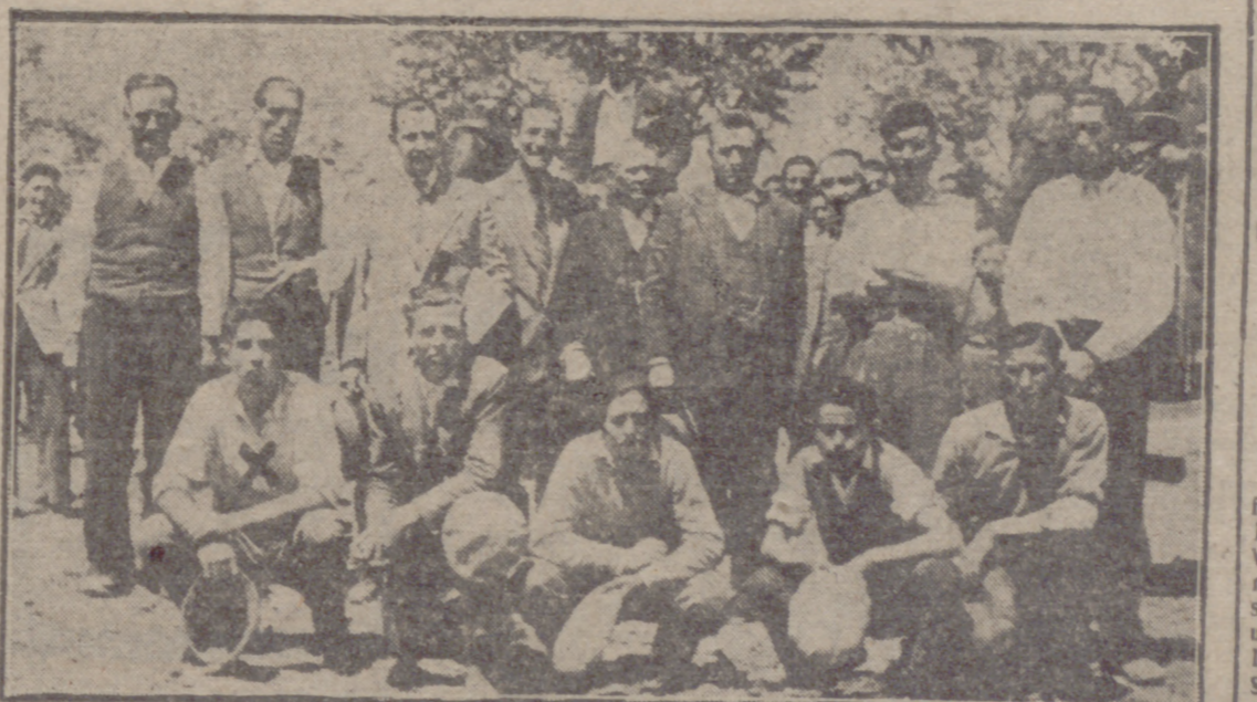
El Jurado y los participantes en las pruebas, entre ellos el primer ganador, marcado con una cruz.