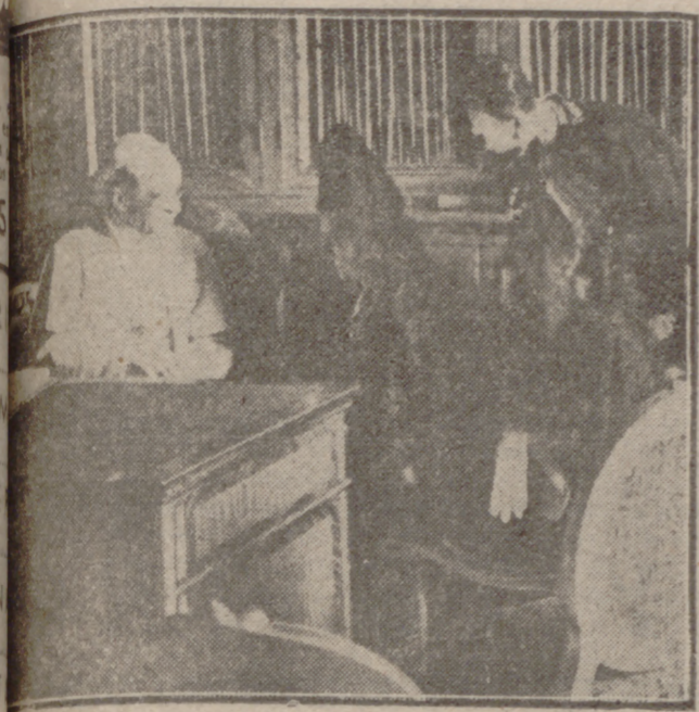
Roma. — Doña Carmen Polo de Franco, acompañada de sus hijos los marqueses de Villaverde, fueron recibidos en audiencia por Su Santidad Pío XII.