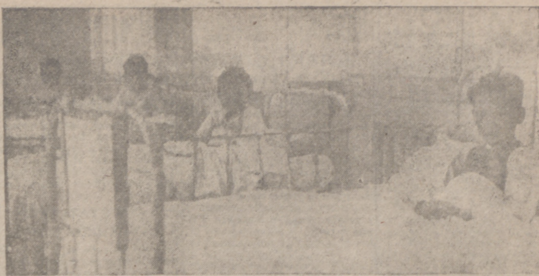
Vallisoletano: Estos pobres niños enfermos esperan tu ayuda!