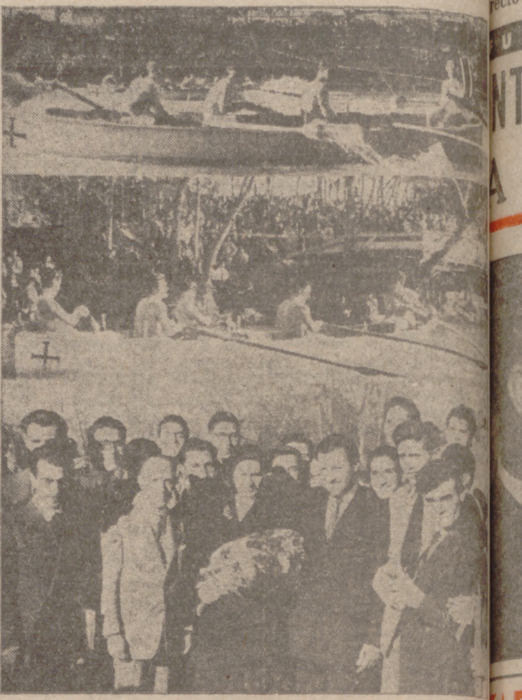
Los peritos de la Escuela de Peritos Industriales, con su madrina y el director del Centro.

Ayer tarde se celebraron en el Pisuerga las pruebas eliminatorias de las VII Regatas Universitarias que con tanto éxito viene celebrando anualmente el Colegio Mayor de Santa Cruz, en colaboración con el S. E. U.