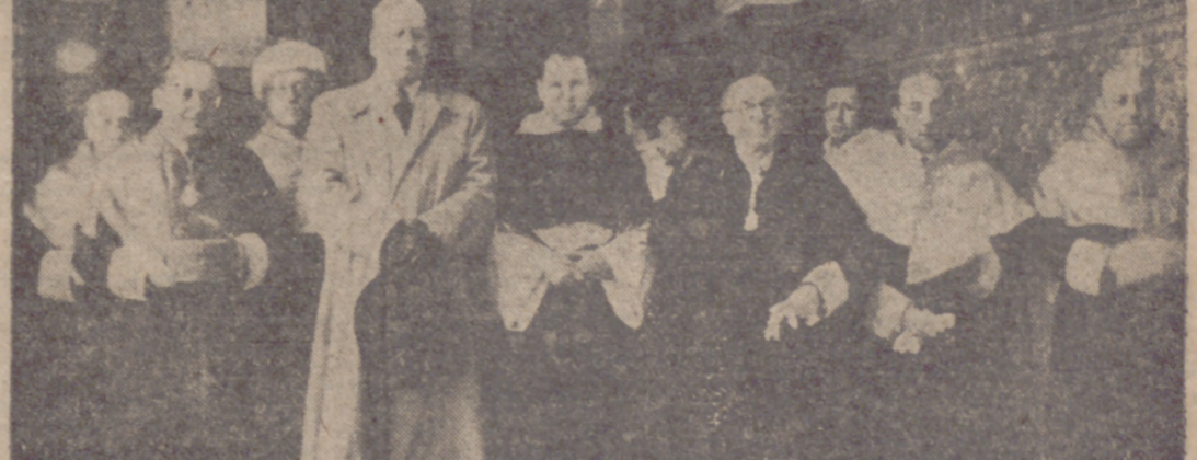
ASISTENTES AL ACTO DE LA UNIVERSIDAD (INFORMACION EN LA PAGINA 3.º)

Nuestro Prelado presidió la misa y el acto académico en el Seminario Metropolitano