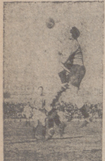
Siempre Argila. Ahora de puño despeja acosado por Vaquero

Una vez más se ha confirmado el axioma de que en fútbol no existen los partidos fáciles. En teoría, este encuentro frente al Oviedo se presentaba como ocasión propicia para una clara victoria que mejorase el coeficiente