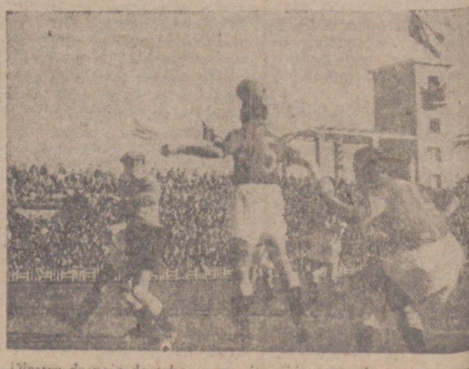
Diestro despeja de cabeza una situación acorralada para su equipo

El Valladolid, que está en el final del primer tiempo, en un remate de cabeza de Jiménez. (Pasa a la página anterior)