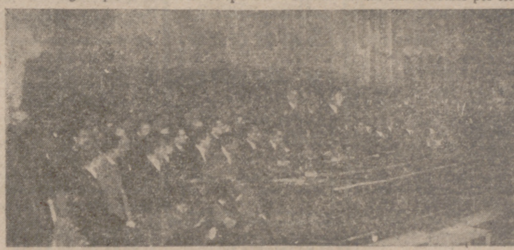
José Antonio pronunciando su histórico discurso el 4 de marzo de 1934

Hasta entonces sólo palabras vanas y sin sentido volaron a través del aire de España y por ello nada más lógico que la actitud de escepticismo absoluto con que eran recibidas por este pue-