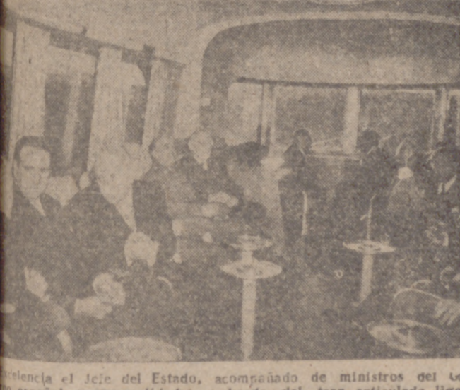
El jefe del Estado, acompañado de ministros del Gobierno español y personalidades, a bordo del tren articulado ligero en su viaje oficial de pruebas hasta nuestra ciudad.