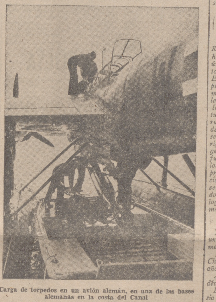
Carga de torpedos en un avión alemán, en una de las bases alemanas en la costa del Canal

También en Tobruk y Gondar los encuentros frontales son intensos, y todo parece predecir que el espacio mediterráneo va a adquirir una mayor actualidad.—Cifra.