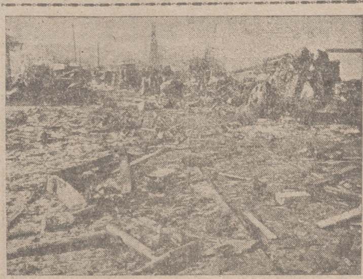
A LA SALIDA DE ODESA.—Las columnas soviéticas que huían de la ciudad fueron machacadas por los "Stukas" alemanes, que impidieron su embarque