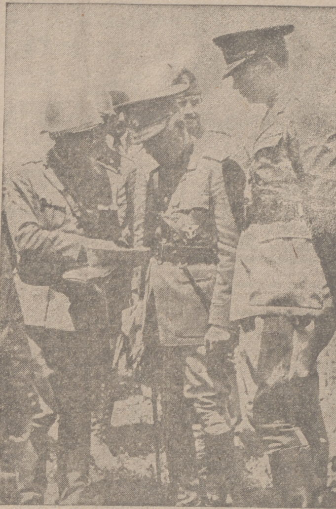
El jefe de una unidad del Ejército rumano explica al rey Miguel y al mariscal Antonescu las operaciones realizadas por sus tropas bajo su mando, en una visita de los jefes del Estado rumano al frente oriental

En tanto se ultiman en el taller los preparativos del trabajo, estará expuesto a las horas de costumbre el tapiz original en el mercado de la Artesanía española.—Cifra.