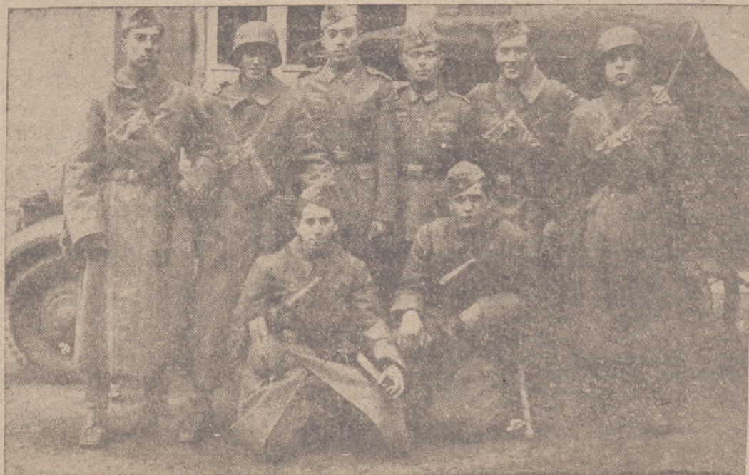
He aquí un grupo de camaradas de la División Azul

Nueva York, 14.—La Embajada soviética de Teheran ha publicado un comunicado en el que declara que, contrariamente a anteriores informaciones, sigue ignorándose la suerte que haya podido correr el avión que transportaba a Litvinof y Steinhart, según manifiesta la agencia "Associated Press"—Efe.