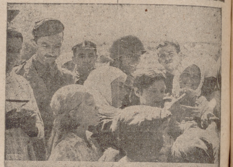
Soldados del Cuerpo expedicionario italiano en Rusia, rodeados de la población de una localidad recién conquistada

Sidney, 22.—El ministro de Comercio de Australia, Page, ha salido para Londres, donde representará al Gobierno de su país.—Efe.