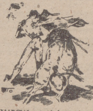
MARCIAL ajustándose en un gran pase de pecho

Pinchó hondo, descabelló a la primera y sonaron algunos aplausos. En su segundo mandó poco al lancear y salió con apuros del trance empujando contra los tableros.