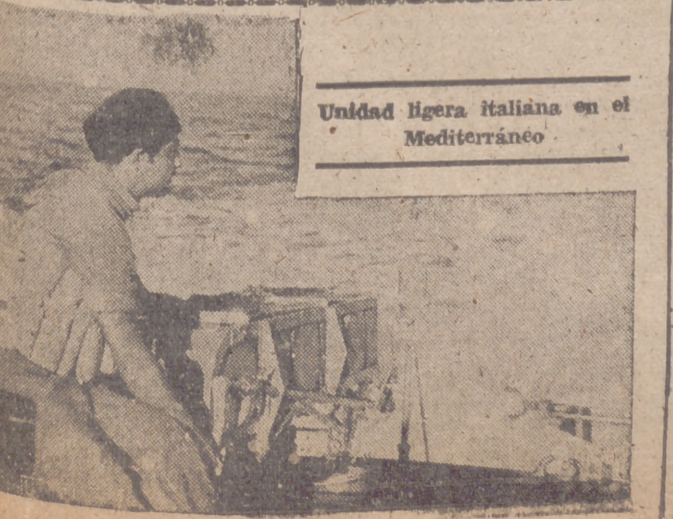
Unidad ligera italiana en el Mediterráneo