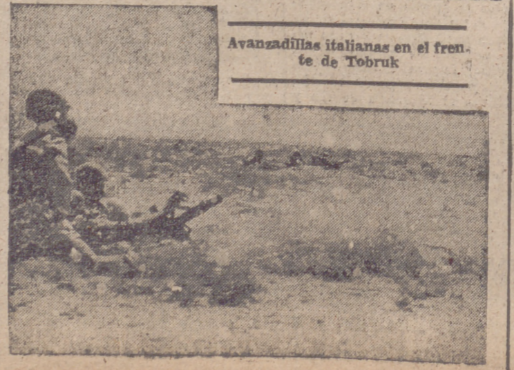
Avanzadillas italianas en el frente de Tobruk