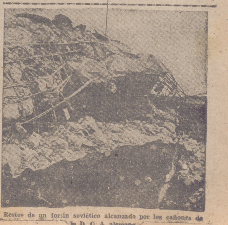
Restos de un forín soviético alcanzado por los cañones de la D. C. A. alemana

la aviación enemiga, siendo derribados 24 aviones enemigos. Trece cazas británicos no han regresado a sus bases, pero los pilotos de dos de ellos han sido recogidos sanos y salvos en el mar. Todos los aviones británicos de bombardeo que tomaron parte en estas acciones han regresado a sus bases."—Efe.