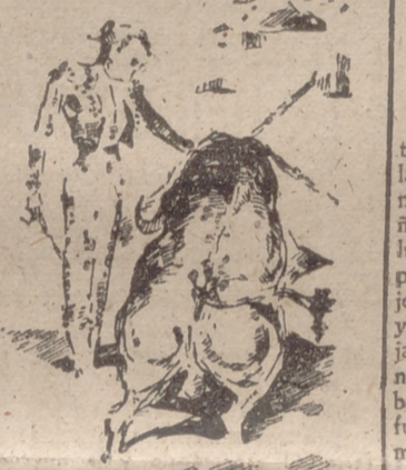
PEPE LUIS toreando al quinto toro

En su primer toro, por no tener nada de malo, y en el segundo por no tenerlo de bueno, estuvo igual: mal.