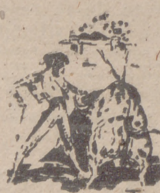
"RAFAELILLO" en un natural valeroso

Marcial, "Rafaelillo", Belmonte, Pepe Luis. Expectación por el cartel grande de la feria. Llamo en la plaza, emoción en los tendidos, interés. Tónico de la fiesta de toros.