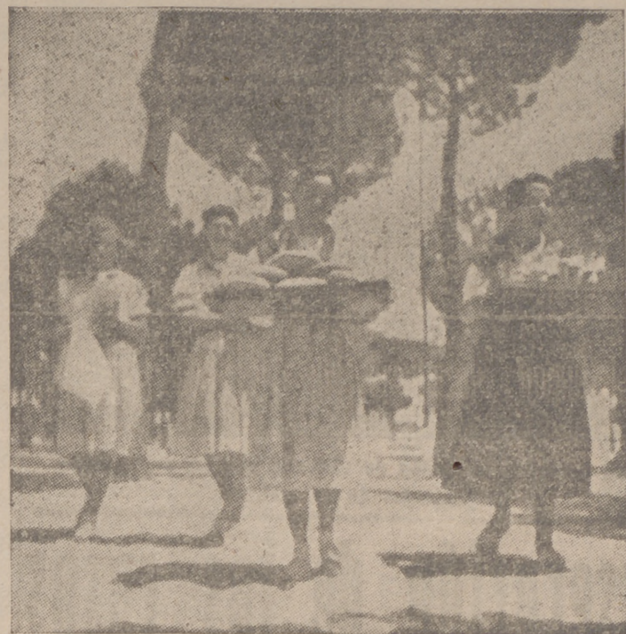
Las camaradas acampadas se preparan la mesa para el almuerzo