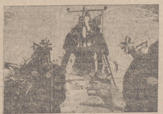
Torpedos italianos en acción contra el enemigo