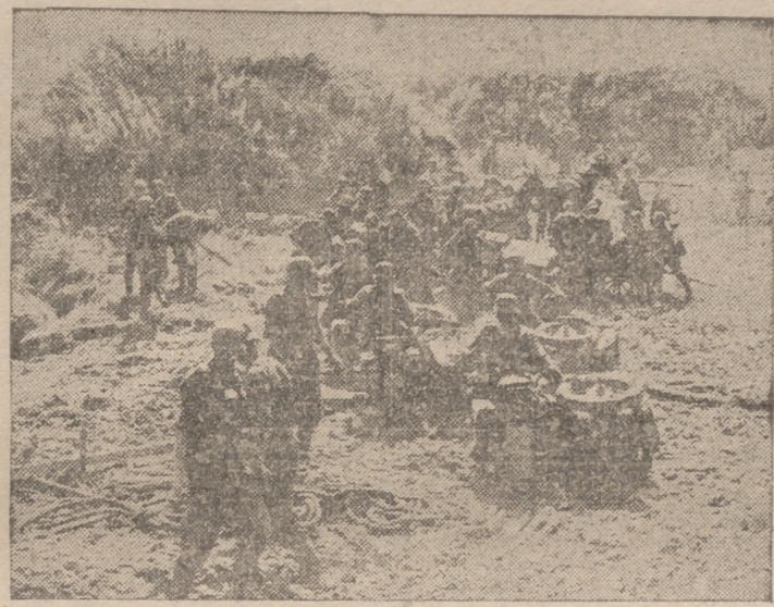
Una división de motociclistas del Ejército alemán espera a orillas del Dniester la orden de avanzar

La Coruña, 13.—Su Excelencia el Jefe del Estado recibió en la mañana de hoy varias visitas. El resto del día lo pasó trabajando en su residencia, hasta el atardecer.—Cifra.