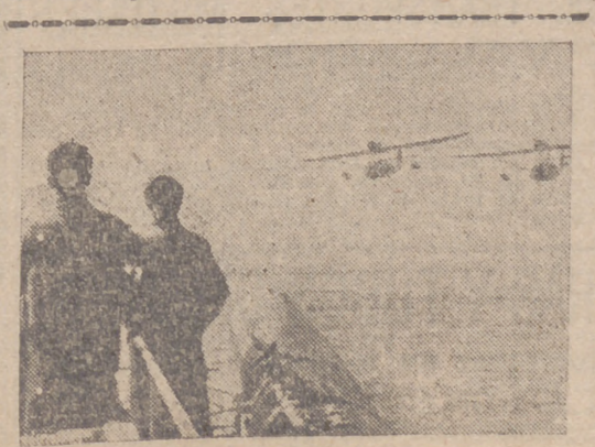
Las fuerzas aéreas italianas, en colaboración con la Marina, en un momento de la batalla del Mediterráneo

Los embajadores inglés y soviético apoyaron oralmente las declaraciones hechas por escrito de sus respectivos Gobiernos.—Efe.