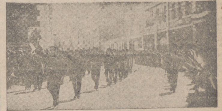
La Centuria del Trabajo desfilar ante las autoridades y jerarquías