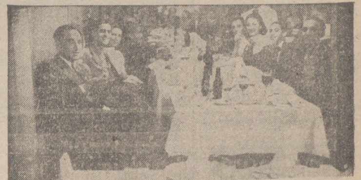
Una de las comidas de Hermandad celebradas ayer por los empresarios con sus obreros