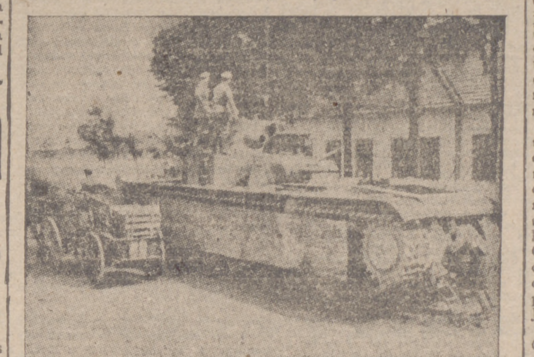
Uno de los gigantes tanques rusos capturados por los alemanes

Washington, 12.—El ministro de Hacienda, Morgenthau, ha procedido a la incautación oficial de diecisiete mercaderes italianos y de los buques-cisternas alemanes "S. Pauline" y "Friedrich". El servicio de costa, que hasta ahora se había encargado de la vigilancia de estos navios, los ha entregado al servicio de aduanas, que se encuentran a las órdenes de Morgenthau. Según la Agencia Associated Press, el ministro de Justicia informó a Morgenthau que probablemente existía un procedimiento para confiscar los navios sin que hubiera lugar a compensaciones, ya que la ley de 1919 prohíbe el sabotaje en los puertos norteamericanos había sido violada.—Efe.