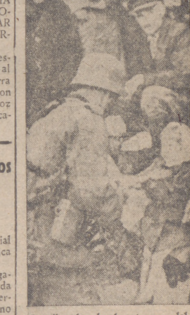
La llegada de las tropas del Reich es acogida con gran entusiasmo por los naturales de Lituania, que se han visto libres de la barbarie roja