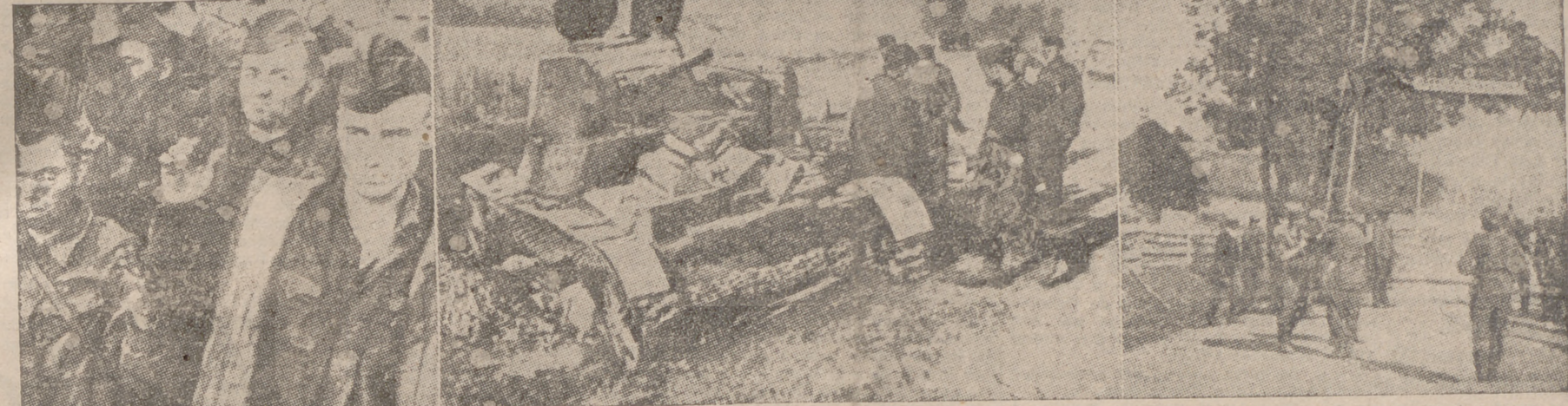
EN EL FRENTE ORIENTAL.—Tipos de prisioneros soviéticos.—Tanque ruso destruido por la artillería alemana.—La estancia de las tropas del Reich en los países bálticos

Inmediatamente después de iniciadas las hostilidades con Rusia, conscientes con este pensamiento, los finlandeses ocuparon las islas Aland, que también aparecen en el gráfico, y que se vieron obligados a ceder a Rusia. De día en día, el bloque a la península de Hangö, donde reside la guarnición rusa, se hace más estrecho, pero Mannerheim conoce a sus hombres como ellos le conocen a él.