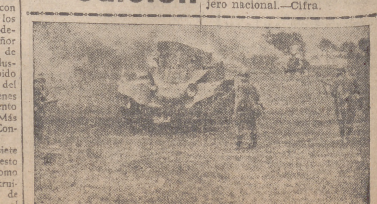
Carro armado soviético puesto fuera de combate por los cañones anticarro alemanes

DIAS... La pro... En la conte... Berlin, comenta... canas y mente co... de agres... dor. El tung" di... blarse de... invadir... práctican... contrario... te Roosev... de la III... ocupan l... pa". El p... do que l... que pued... exclusiva... rica.—Efe... Washing... Roosevelt... mente a l... la confere... que Alem... dia, y de... pensando... dido otra... so. Interro... res contie... der, y se... pas norte... Greenland... taba de l... la defen... to; no po... El pres... dias de or... les los E... establecer... teórica... do sin re... los avione... mente di... Con re... VISTA... La... No h... los norte... do se en... que difi... tar a los... al Gobie... Chang-K... Pero... ya que l... ma Ingle... a las pr... guerra y... los inter... las impo... superab... Pero... sus med... que ha... con las... pón con... ción act... Mata... tentos d... ficas de... una fras... a Washi... dos naci... Pero... A las m... han res... Estador... tarde, c... cualquier... No... los acue... a Tokio... queda d... allí se d... En... visible... tranquil... una gue... mento p... quilidad... Alen... para res... mundo.