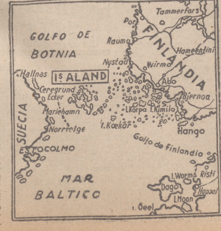
Map showing the Baltic region, including the Gulf of Bothnia, the Baltic Sea, and the island of Aland.