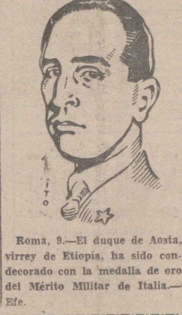
Roma, 9.—El duque de Aosta, virrey de Etiopía, ha sido condecorado con la medalla de oro del Mérito Militar de Italia.