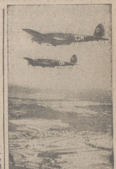
Escuadrilla de combate alemana en vuelo contra la isla inglesa. Los terribles bombardeos de represalia de la aviación alemana reducen a escombros las grandes ciudades inglesas

llegar hasta verter la sangre de sus hermanos, que defienden la unidad del imperio francés y la soberanía de Francia. Al dolor que produce este hecho, nuestra nación puede oponer con orgullo y plena conciencia la verdad de que no ha sido ella la que ha alzado las armas contra su antigua aliada, como tampoco las empleó en Masalquivir o en Sfax. Pero la astucia ha precedido a la violencia. Desde hace días la propaganda que forjaba el pretexto para la agresión afirmaba que tropas alemanas, en gran número, habían desembarcado en nuestros puertos de Levante y que Francia estaba a punto de entregar a Alemania estos territorios, a cuya defensa se ha comprometido. Vosotros que estais ahí sabéis que todo esto es falso; que los pocos aviones que hicieron escala en esas tierras han abandonado ya Siria, con excepción de cinco a seis que no estaban en condiciones de despegar. Vosotros sabéis que en Siria y en el Líbano no hay ni un solo soldado alemán. Así, pues, habéis sido víctimas de una agresión profundamente injusta, que provoca la indignación de nuestras conciencias. Esta es la primera vez que se ve amenazada la integridad del Líbano; pero podéis creerme: nuestro alto comisario os lo ha dicho ya en dos ocasiones, y os lo repito ahora: combad por una causa noble y justa, por la inviolabilidad de los territorios que la Historia confió a la patria. Sabreis defenderlos, estoy seguro. Y mis votos, con los de Francia entera, os acompañan en este trance.—Efe.