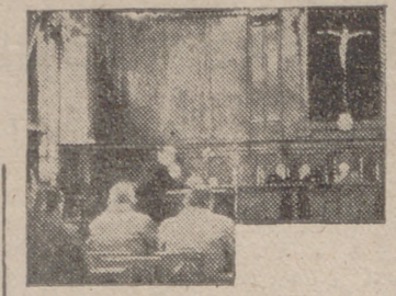
El camarada Carlos Sanz Alonso