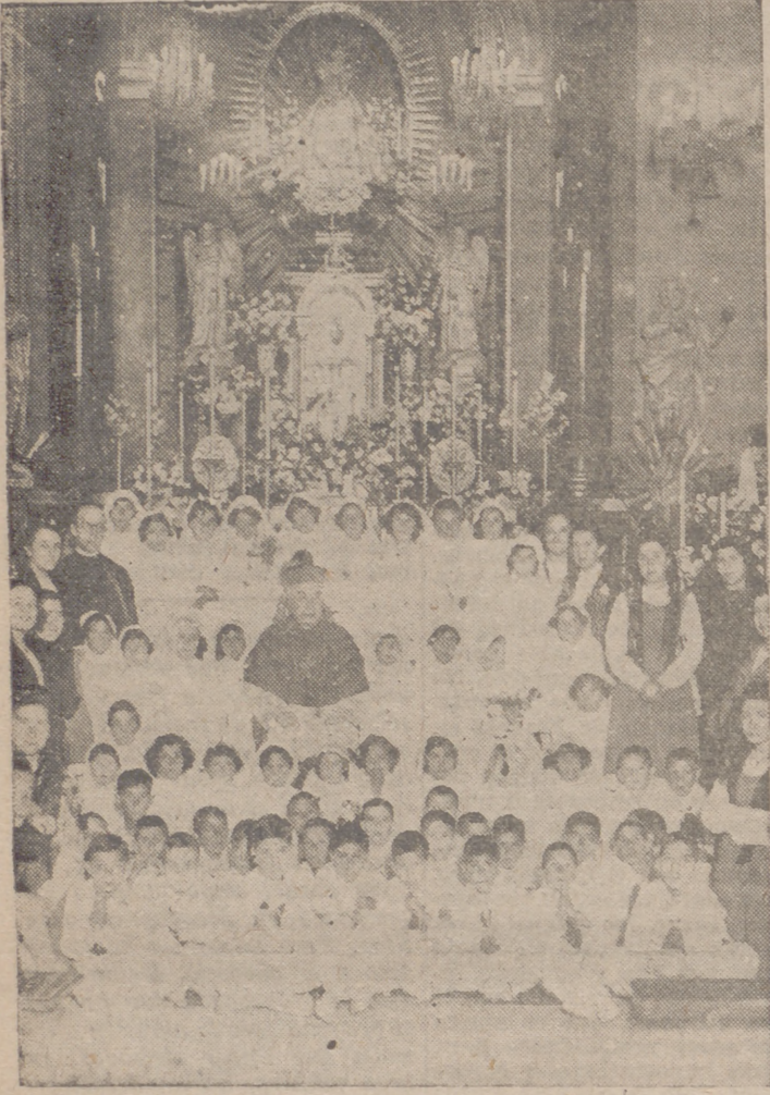
El pasado domingo, fiesta de la Santísima Trinidad, tuvo lugar en la iglesia parroquial de Nuestra Señora...