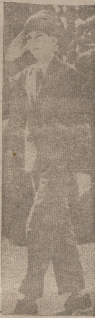
He aquí al rey don Pedro II de Yugoslavia. La foto es de 1937. El actual rey de Yugoslavia sale de los funerales celebrados en Belgrado en sufragio del alma de su padre, asesinado en Marsella en 1934

Londres, 29.—Cuando esperaba para ser transportada una saca de correspondencia de América en Londres explotó una bomba que iba oculta en el interior de la misma. No produjo ninguna víctima, y sus fragmentos han sido entregados a la Policía para averiguar el origen de la misma. El explosivo está fabricado con un tubo de plomo retorcido en los extremos.—Efe.