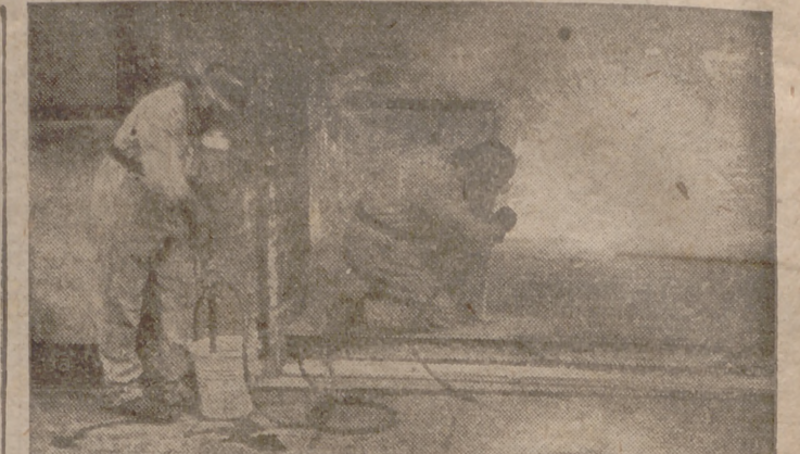
Defensa de la población civil contra bombas incendiarias.—Para combatir el peligro de las bombas incendiarias que tiran los aviadores ingleses, se enseña en Alemania a la población civil algunos métodos eficaces de defensa. Nuestra foto muestra a dos particulares que llevan cascos de acero apagando el incendio de una bomba por mediación de una bomba de incendio manual. Claro está que los hombres buscan durante su actividad una cubierta. En esta foto el hombre de la derecha está cubierto detrás de una tabla y el segundo detrás de una pared, protegiéndose contra la metralla de la bomba.

Madrid, 29.—Los árbitros designados para los encuentros oficiales de mañana, domingo, son los siguientes: Real Club Celta-Zaragoza, Vilari; Deportivo Castellón-Deportivo Coruña, Gojenuri; Real Sociedad-Recreativo de Granada, Melcón. Copa del Generalísimo.—Barcelona-Arenas, Achalandabaso; Real Gijón-Villares, Menchaca; Osasuna-Real Unión de Irún, Mazagatos; Valladolid-Salamanca, Alvarez Orriols; Sabadell-Levante, Bonet; Malacitano-Jérez, Domínguez; Gádiz-Betis, Eguiño; Cartagena-Córdoba, Sanchis Orduna; Ferrol-Real Santander, Fontbona; y Girona-Badajona, Coll-Ah. El.