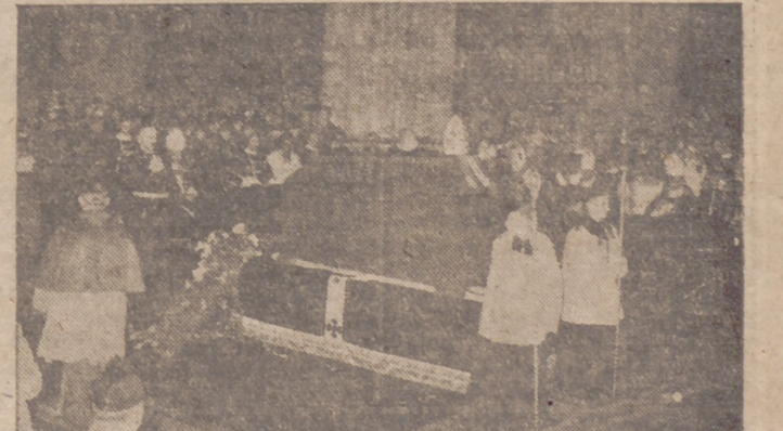
El entierro del Cardenal doctor Schulte tuvo lugar en la Catedral de Colonia. En esta foto aparece el representante del Gobierno alemán depositando una corona

Madrid, 29.—El "Boletín Oficial del Estado" publica una orden de Educación Nacional por la que se distribuyó el crédito global de treinta y cinco mil trescientas sesenta pesetas de material de oficina no inventariable para las Escuelas Normales que se citan en el ejercicio económico actual. Entre las citadas figuran las de Alicante, Barcelona, Burgos, Cádiz, Gerona, Granada, Guipúzcoa, Huelva, Huesca, Lérida, Logroño, Lugo, Málaga, Murcia, Navarra, Palencia y Valladolid.—Cifra.