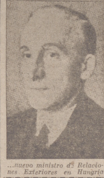
...nuevo ministro de Relaciones Exteriores en Hungría