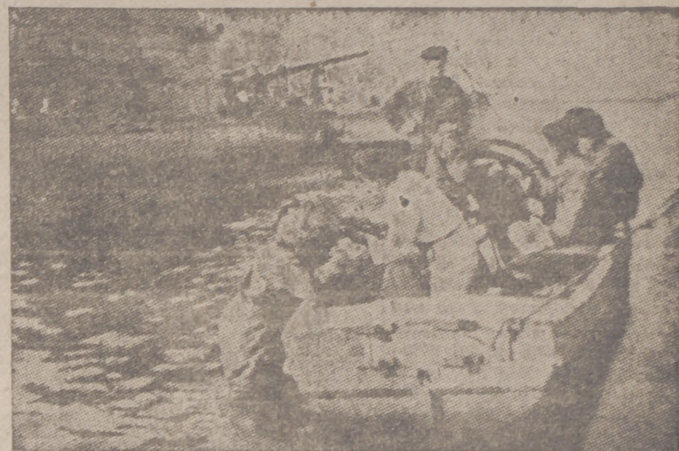
Un buzo de la Real Marina italiana sale a la superficie después de haber realizado la revisión del casco de un submarino que regresa de un crucero de guerra

Procedente de Tetuán ha llegado a Madrid el general Asensio, alto comisario de España en Marruecos. El alto comisario conferenció en la tarde de ayer con el ministro de Asuntos Exteriores, camarada Serrano Suñer. En breve será recibido por S. E. el jefe del Estado.