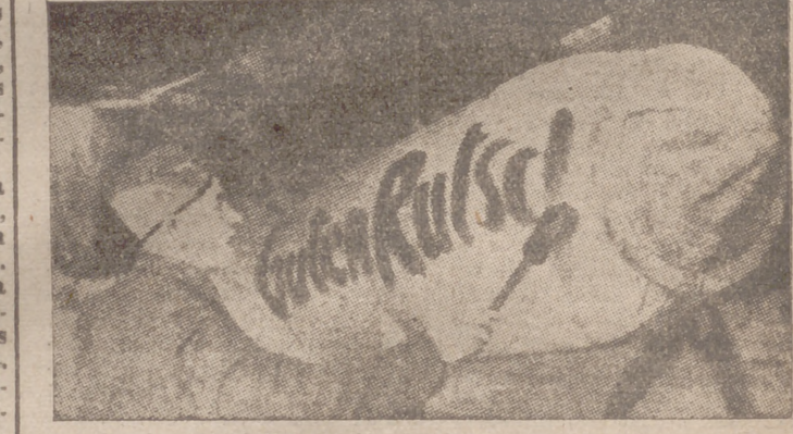
Un avión alemán, poco antes de partir hacia los objetivos de la costa inglesa.—Sobre la bomba de grueso calibre, destinada al enemigo, un soldado escribe su augurio

En su respuesta, Butler insistió en que el Gobierno británico "no ha querido llevar la cuestión adelante".—Efe.