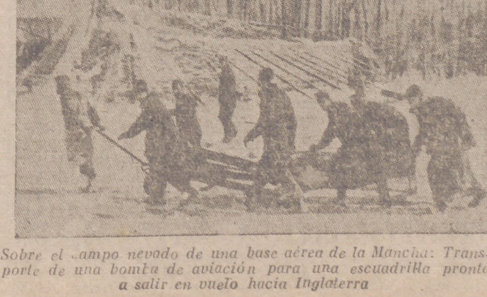
Sobre el campo nevado de una base aérea de la Mancha: Transporte de una bomba de aviación para una escuadrilla pronta a salir en vuelo hacia Inglaterra