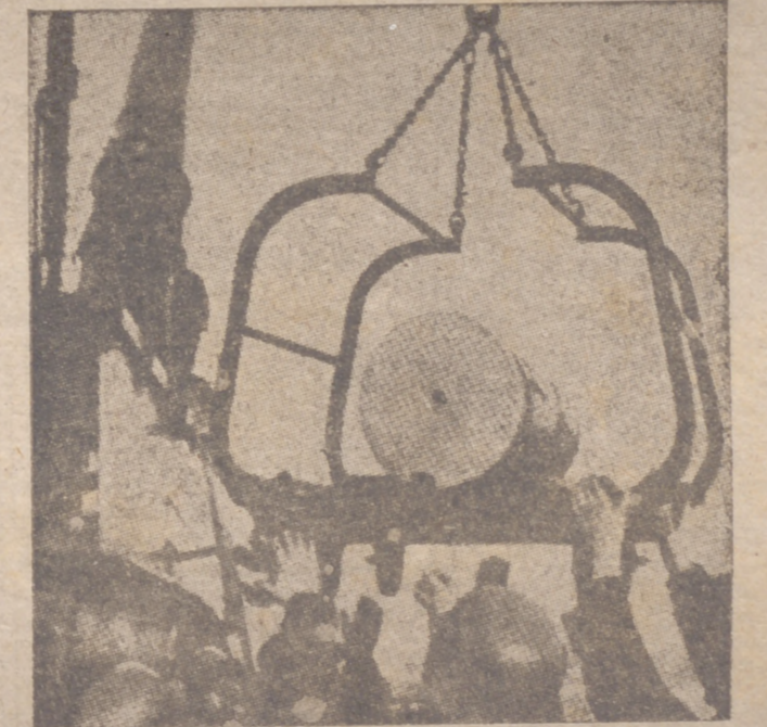
Para cortar el tráfico inglés en el Canal de la Mancha; los alemanes emplean estas piezas de grueso calibre, cuyos proyectiles tienen que ser transportados por grúas

Madrid, 21.—El exrey Carol ha testimoniado su condolencia con motivo de la catástrofe de Santander y ha remitido para los damnificados un donativo de 3.000 pesetas.—Cifra.