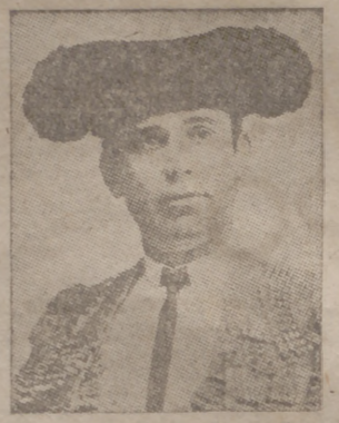
"Guerrita" en la época de su retirada

Entre los éxitos más grandes de "Guerrita" destaca, más que por el resultado artístico, por el esfuerzo que supuso, el de las tres corridas que toreó el 19 de mayo de 1895: a las siete de la mañana, en San Fernando, alternando con "Pepele II" en la lidia de seis toros de Saltillo; a las once, en Jerez de la Fronte-