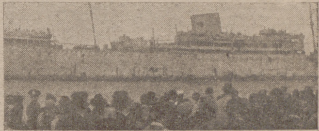
El crucero auxiliar inglés «Carnarvon Castle», averiado considerablemente en la lucha contra un crucero auxiliar alemán, se refugió en el puerto de Montevideo

Palencia, 18.—El gobernador civil de Santander ha facilitado una nota en la que dice que quiere que llegue hasta lo más íntimo de los que padecen por la catástrofe que todos los españoles están en pie llenos de tristeza, pero con el alma fortalecida y llena de energía laborando para lograr salvar la tremenda situación planteada a Santander y a su provincia. Son días de sacrificio, y hemos de vivir duras horas hasta conseguir la total normalización de la vida comercial, tan durísimamente afectada por el siniestro. Son importantes los ofrecimientos particulares y oficiales de todos los órdenes que se han recibido, y el Gobierno de la nación nos dará elementos sobrados para el logro de lo que es un deber. Termina diciendo: «Mi confianza es absoluta. Que ella sea garantía de ánimo para (Pasa a la cuarta página)