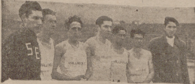
Equipo del Distrito de Valladolid, que participó en el cross nacional del S. E. U.