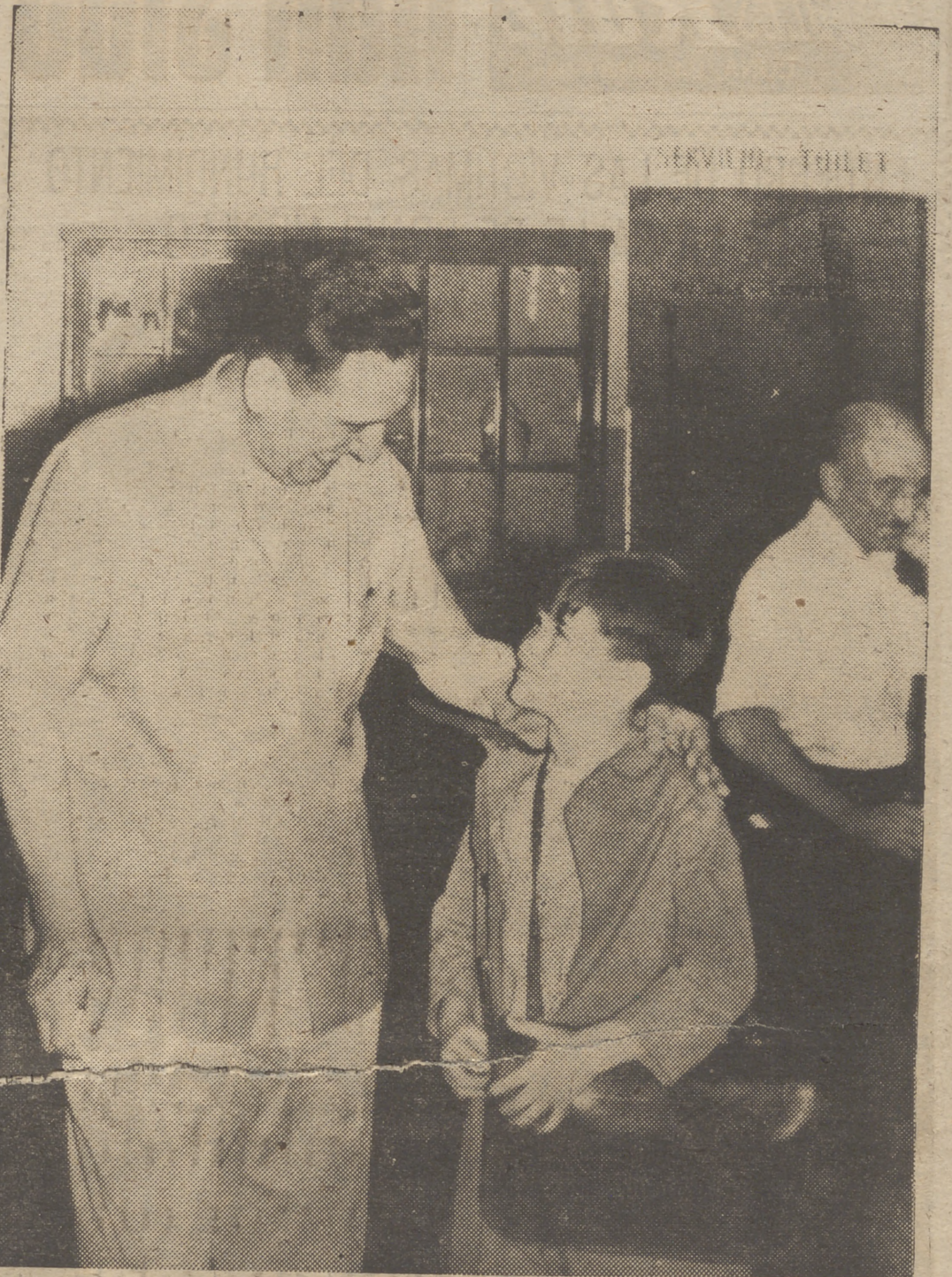
Juan D. Perón, en Colón, de Panamá, se ha transformado en una figura popular, y con frecuencia se le ve conversando con niños y personas de todas las edades, al igual que solía hacerlo en Argentina.