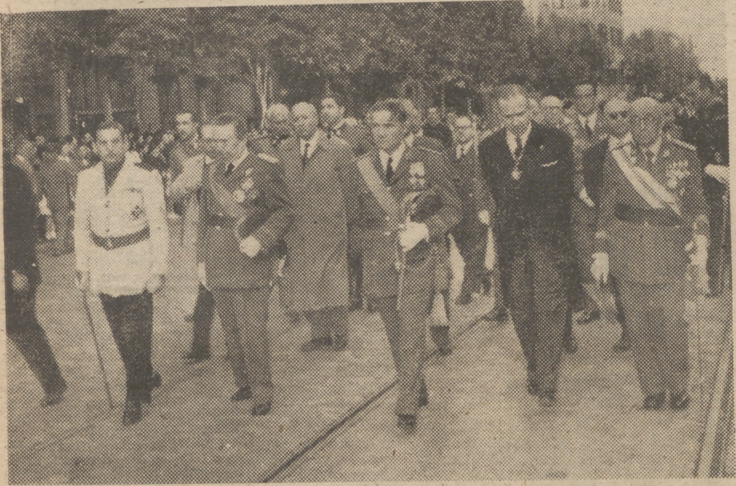
Presidida por el ministro del Aire, teniente general González Gallarza, y otras altas autoridades, ha recorrido el barrio de Argüelles la tradicional procesion eucaristica.