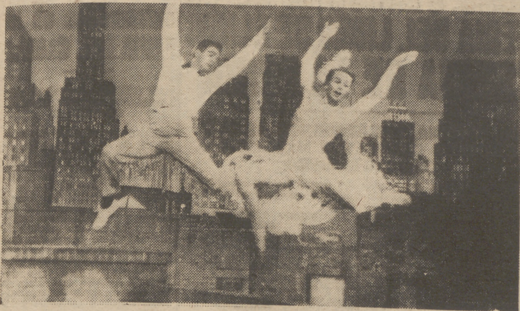
"Tres chicas con suerte", película en technicolor con los excepcionales bailarines Marge y Gower Champion en los papeles estelares en este film musical, que será una de las más juveniles y atractivas producciones de la temporada, se estrena hoy, lunes, en el Carlos III y Roxy B. Después de sus anteriores éxitos vuelven a aparecer en la pantalla, ofreciéndonos ahora más espectaculares números de baile. Compartiendo honores estelares con ellos se halla Debbie Reynolds, la vivaracha actriz que ascendió a la cumbre de la fama después de su magnífica actuación en "Las tres noches de Susana". También son dignos de mención Helen Wood y Bob Fosse, dos jóvenes que demostraron su valor artístico en los escenarios de Broadway.