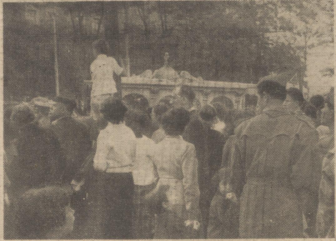
La fotografía recoge un momento del paso del impresionante cortejo.

Se había retrasado la boda porque hubo que rehacer la partida de nacimiento del novio