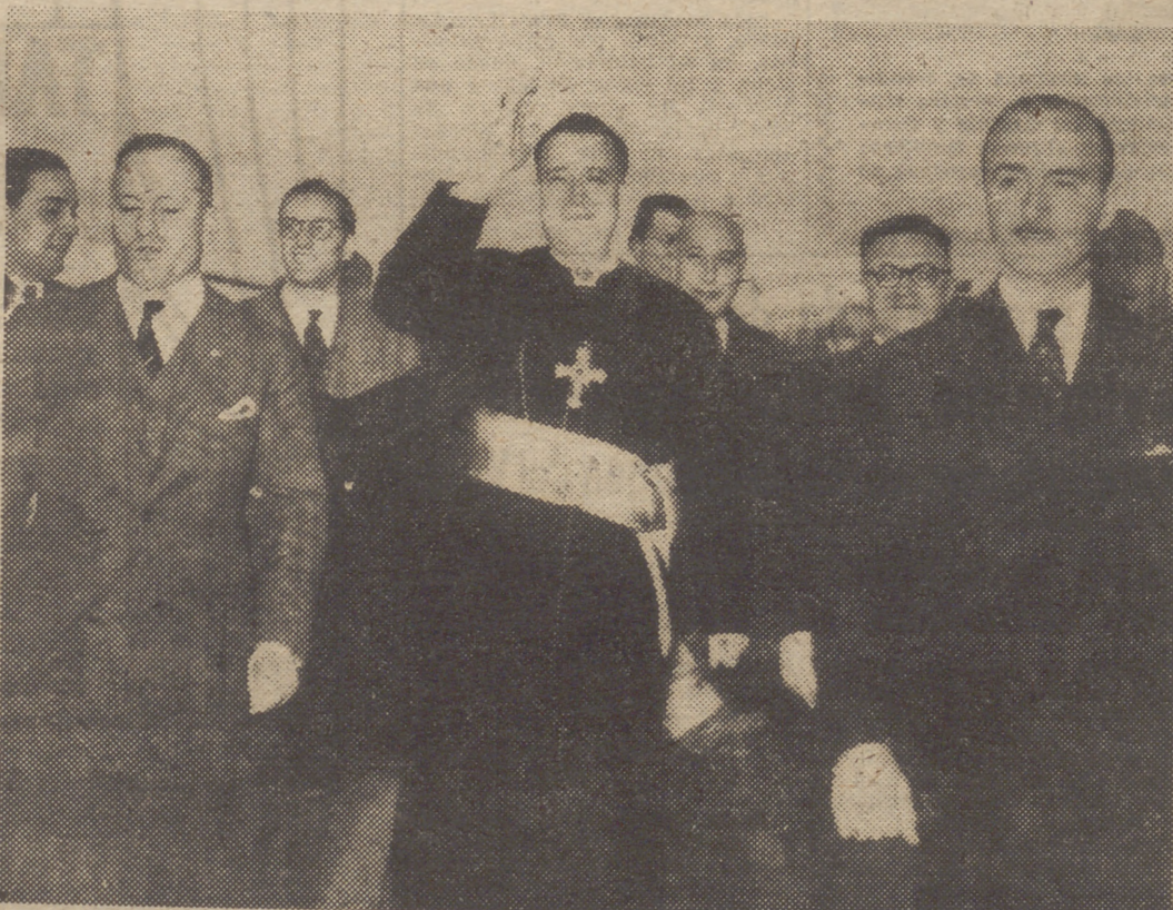
Monseñor Tato, obispo auxiliar de Buenos Aires, que fué expulsado de Argentina por el Gobierno del general Perón en los últimos momentos, regresa triunfalmente al país el 22 de octubre de 1955, tras el triunfo de la revolución.