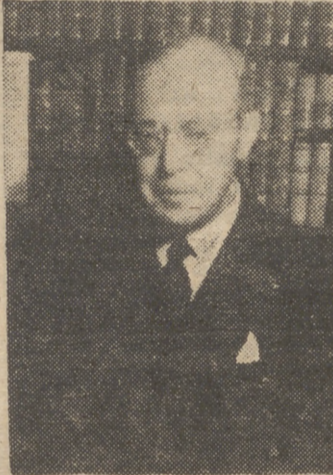
Don Agustín González de Amezúa, que le fué concedida el 18 de julio de 1950. En 1953, la Real Academia de la Historia le eligió para cubrir la plaza de director de la Corporación, vacante por fallecimiento del duque de Alba.

démico de número de la Real Academia Española, leyendo su discurso de ingreso en 1929 sobre "Formación y elementos de la novela cortesana". En 1942 se le eligió académico de la de la Historia, de cuyo cargo tomó posesión el 24 de febrero del año 1944, disertando acerca de "Una Reina de España en la intimidad: Isabel de Valois". El 19 de mayo de 1945 la Real Academia de Jurisprudencia celebró sesión para darle posesión del cargo de académico, tratando de "Las Cortes en el siglo XVI. Vida de un procurador". Se hallaba en posesión de la cruz de la Orden Civil de Alfonso X el Sabio, que le fué concedida el 18 de julio de 1950. En 1953, la Real Academia de la Historia le eligió para cubrir la plaza de director de la Corporación, vacante por fallecimiento del duque de Alba.