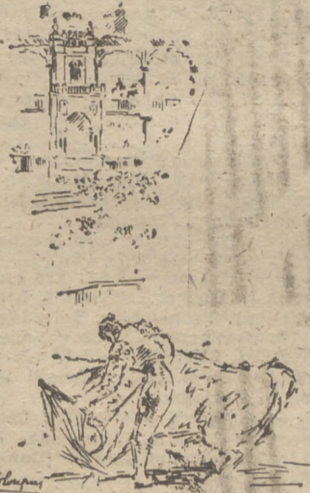
Un natural de Mario Carrión. (Dibujo de Colongues.)