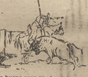
Una buena vara en el quinto toro.

co", y Joselito Huerta saludó ovacionado.