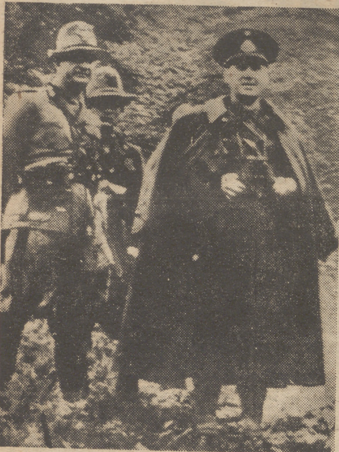
Juan D. Perón, a la derecha, en primer plano, cuando era coronel y agregado militar cerca de la Embajada Argentina en Roma, asiste en 1938 a las maniobras de algunas unidades de la "Tridentina".