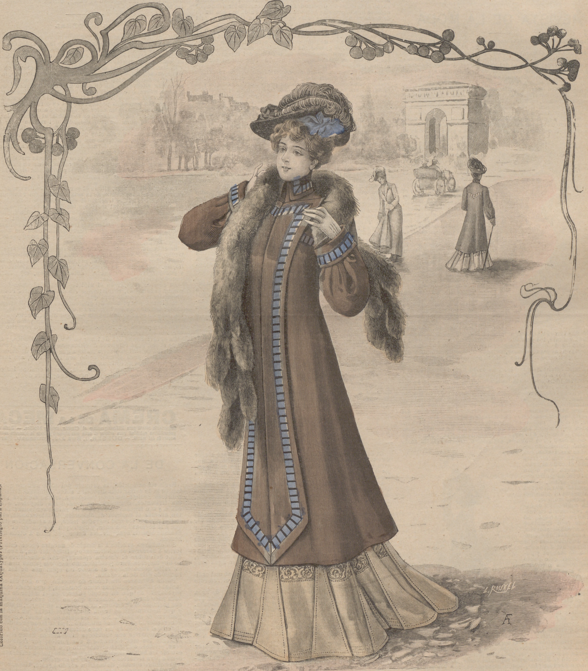
1. Elegante toilette fantasía.

SUSCRIPCIÓN 6 Meses. 1 Año. En toda España. 4 pts. 7'50