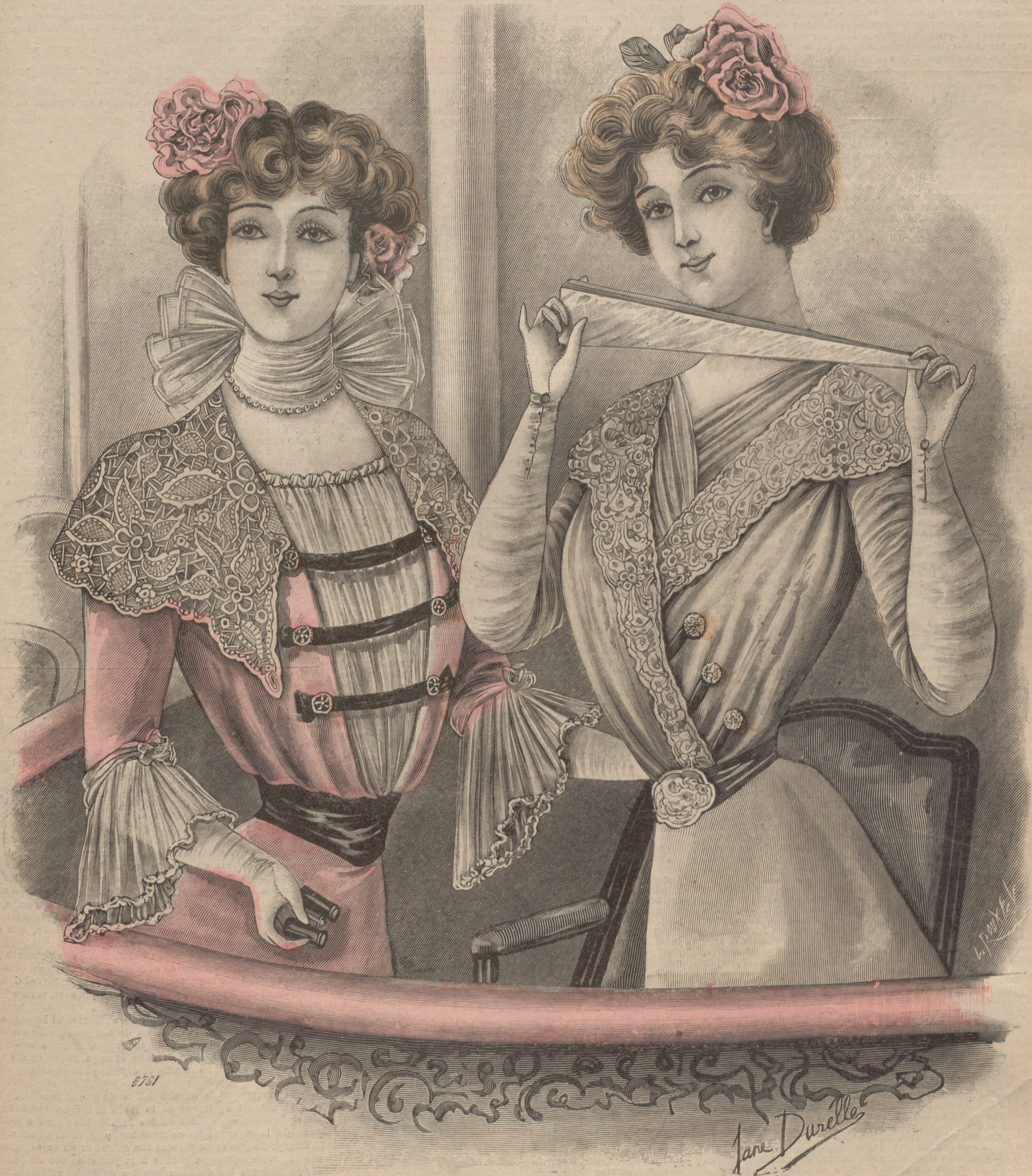
1. Cuerpos para teatro.

SUSCRIPCIÓN 6 Meses. 1 Año. En toda España 4 pts. 7'50