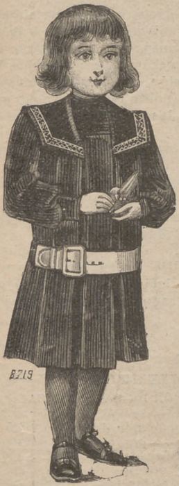
9. Traje Morgan , para niño de dos á tres años, de terciopelo côtelé marino ó granate, forma blusa, plissé por delante y por la espalda á grandes pliegues redondos, montados sobre un canesú cuadrado, recubierto de un cuello marino, orlado por un entredós de guipure. Mangas de puño. Cinturón de cuero blanco.