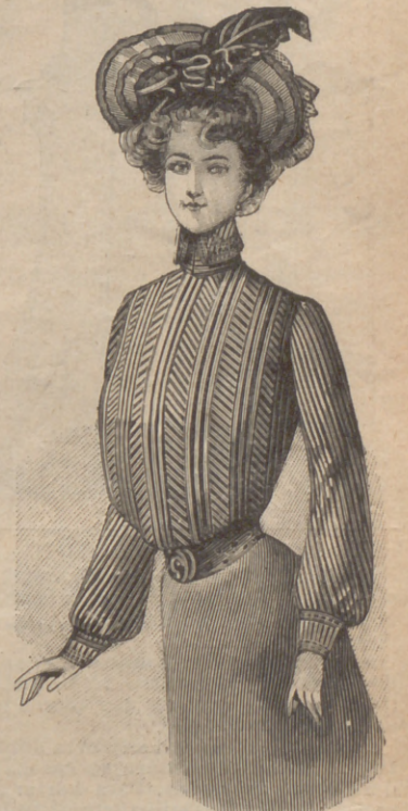
14. Elegante cuero Cassive . Es precioso confeccionándole de terciopelo listado negro y blanco. Cuello vuelto y mangas última novedad.