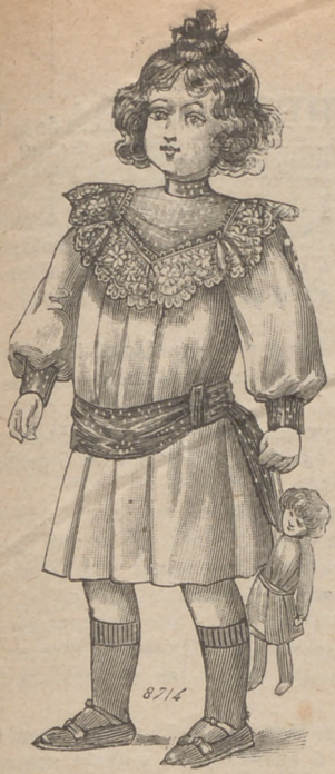
6. Vestido para niña de dos á cinco años, de granité fantasia crema, celeste, rosa, marino ó granate. Delantero y espalda plissés á grandes pliegues, sujetos por una banda de seda anudada detrás. Canesú de seda guarnecido de encaje. Cuello recto. Mangas-blusa, con puño. La seda es crema, celeste ó rosa.