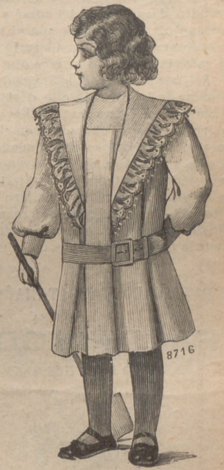
11. Vestido Jack , de piqué blanco, para niño de dos á cuatro años. Delantero y espalda plissés sobre un canesú cuadrado. Sujeta los pliegues un cinturón de cuero. Gran cuello marino guarnecido de bordado formando solapas.