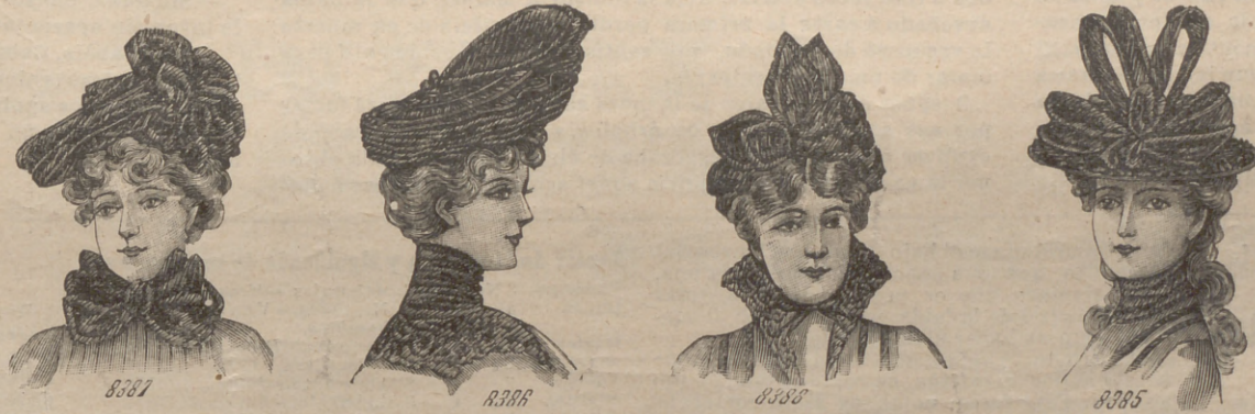
10. I. Toquilla de crepón para señora joven, guarnecida á un lado por un magnífico chou . — II. Toquilla de crepón para señorita. Fondo y bordes plissés . La parte superior se adorna con dos palas. — III. Toca de crepón con bridas, para señora mayor. Fondo drapeado ó jaretado. Cocas armadas de latón. — IV. Sombrero de crepón para niña, guarnecido de un retorcido y cocas armadas de latón en el delantero.