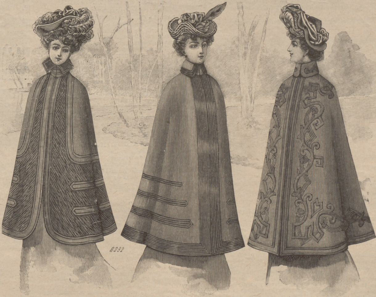
13. I. Capa de paño negro y crepón inglés, forma esclavina, rodeada de junquillos respunteados . Cuello reversible. Mat.: 3 m. paño, 2 m. crepón . — II. Capa de paño beige, ajustada en los hombros por medio de pinzas y guarnecida de varias trenzillas de seda del mismo color. Cuello vuelto. Mat.: 3 m. paño. — III. Capa de paño verde Nilo, cortada en forma y adornada de aplicaciones de paño formando bonitos dibujos. Cuello vuelto. Este abrigo va forrado de tafetán.