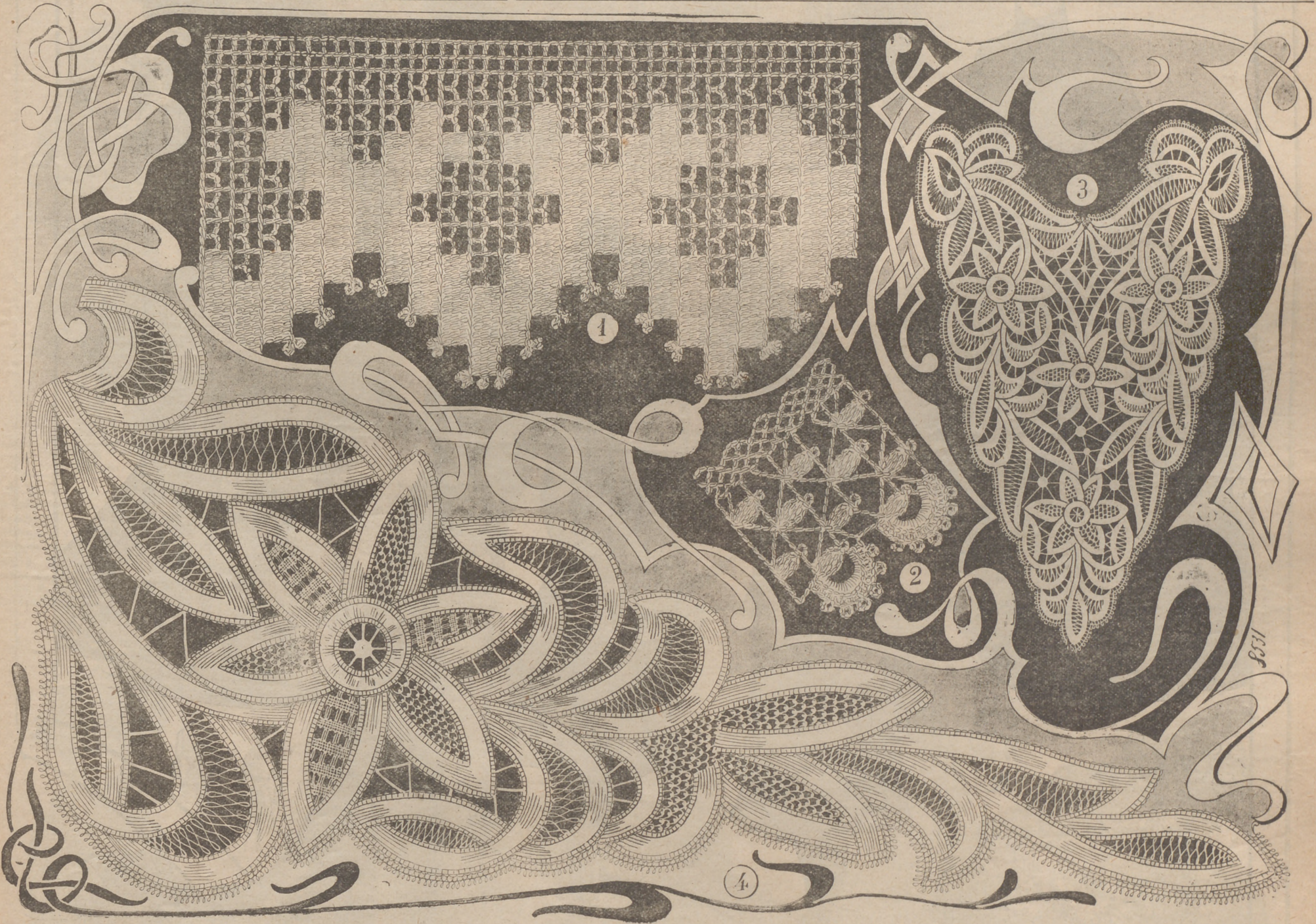
2. Encaje al crochet. — 3. Encaje al crochet género guipure. — 4. Plastrón y solapas en encaje Renacimiento.

Importante receta para blanquear el Cutis, sano y hínfico. — Basta una pequeña cantidad para aclarar el cutis más obscuro y darle la blancura suave y nacarada del marfil. — DUSSER, 1, Rue J.-J. Rousseau, París.