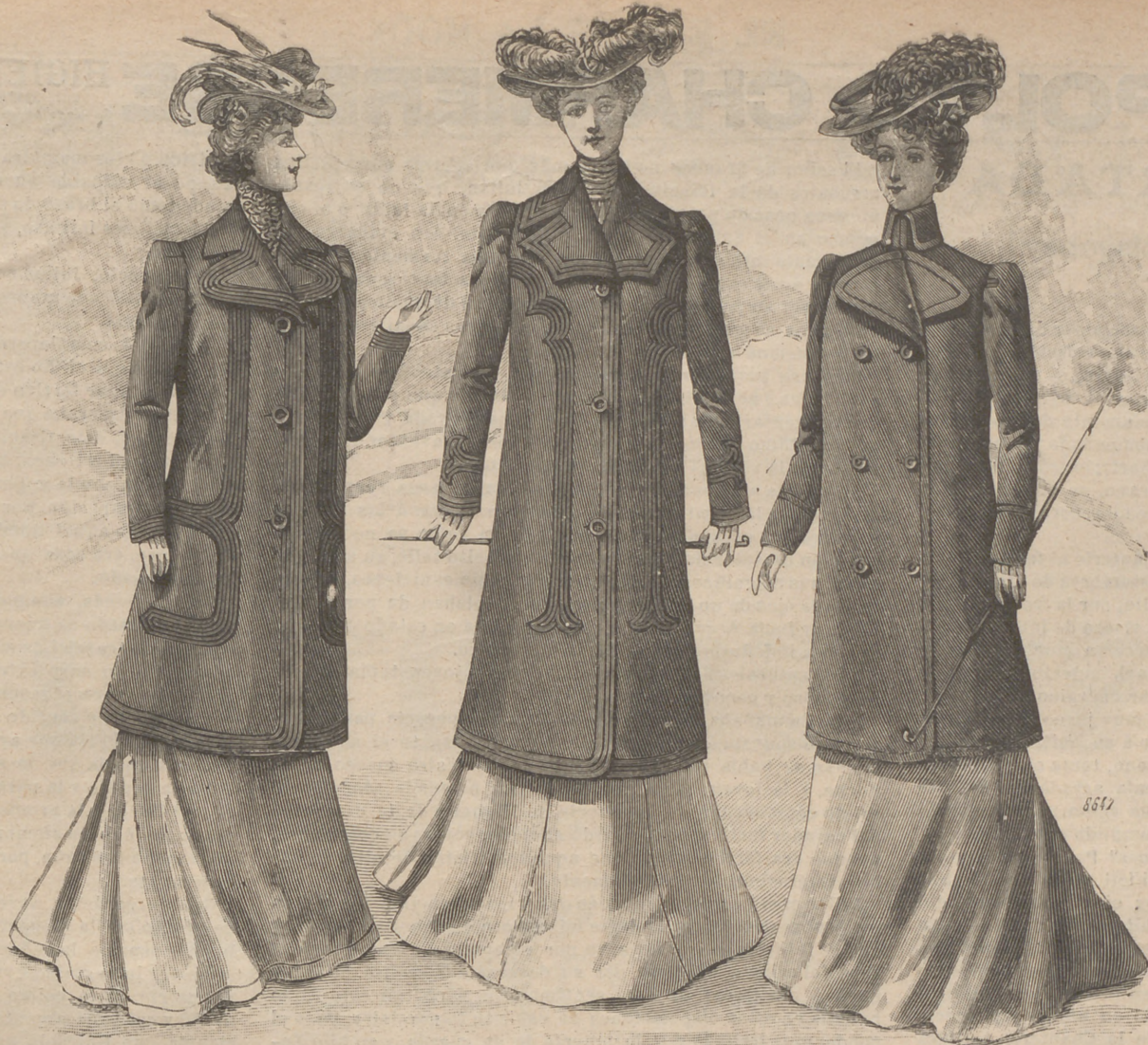
7. I. Paletó-saco de paño Succia , compuesto de espalda de una sola pieza y delantero cruzado. Cuello vuelto formando solapas. Mangas de dos costuras. Guarnición de junquillos respunteados en toda la prenda. Mat.: 3'5 m. paño. — II. Paletó-saco de paño negro, cruzado por delante y abrochado con botones de búfalo. Cuello redondeado y solapas cuadradas. Mangas de codo. Mat.: 3'25 m. paño. — III. Paletó-saco de paño gris, guarnecido de respuntes y dos hileras de botones fantasia. Cuello vuelto. Los delanteros se vuelven en solapas. Mangas de dos costuras. Mat.: 3'25 m. paño.