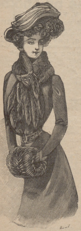
12. Cuello de pieles Boreal , de marta de Laponia, forrado de raso y cabecita disecada. O-ho colitas terminan muy graciosamente este abrigo de pieles.