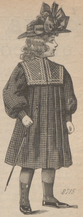
8. Abrigo Suzy , para niña de dos á cinco años, de tela á cuadros, última novedad. Este abrigo, de forma americana, ostenta un canesú cuadrado y lo recubre un cuello marino adornado de galón. Mangas blusa con puño. Los colores dominantes son granate, marino y verde. — Sombrero Arma , de fieltro guarnecido de un lazo de raso.