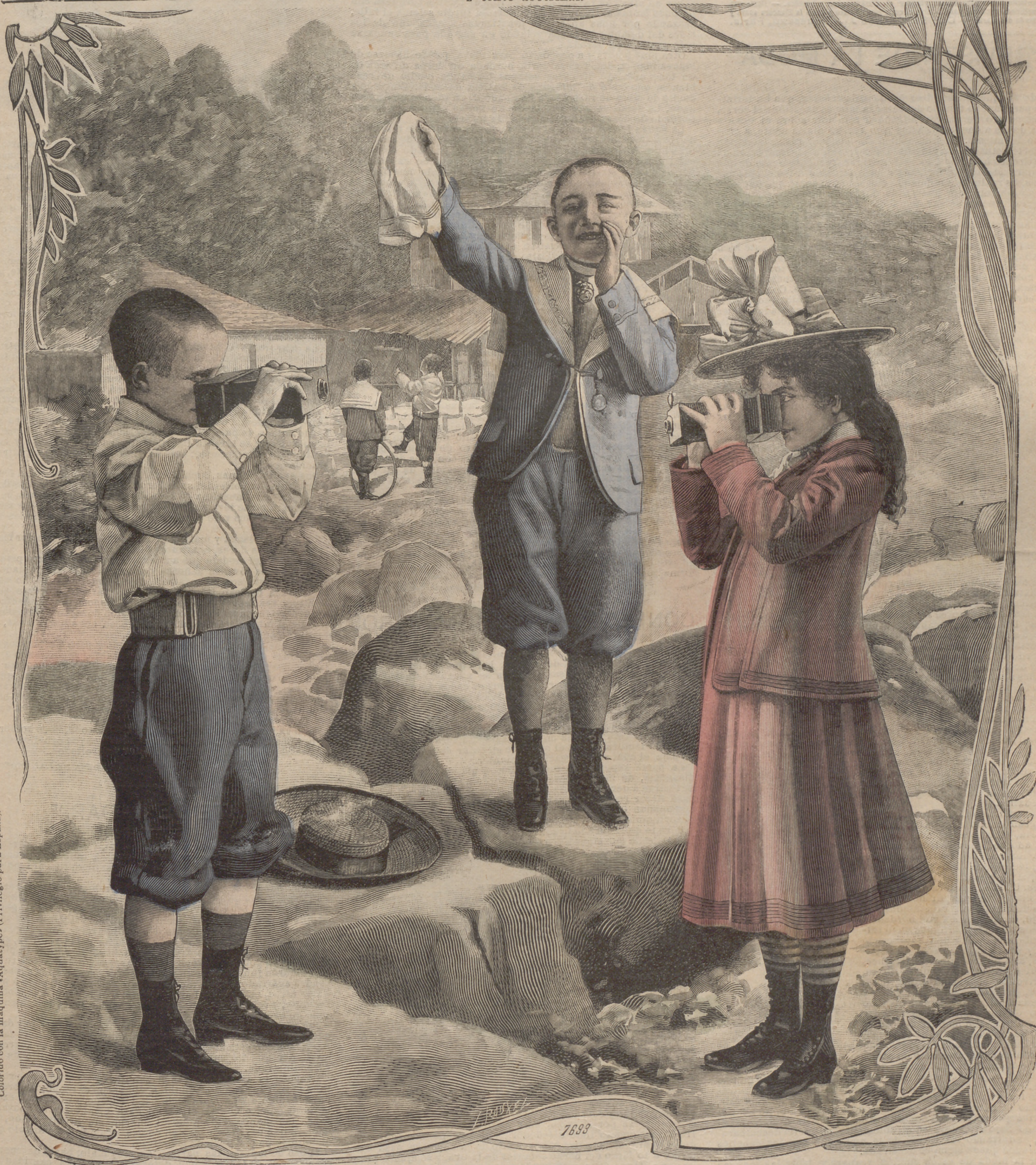
Colorido con la máquina «Aquatypes» (Privilegio para España).

SUSCRIPCIÓN 6 Meses. 1 Año. En toda España 4 pts. 7'50