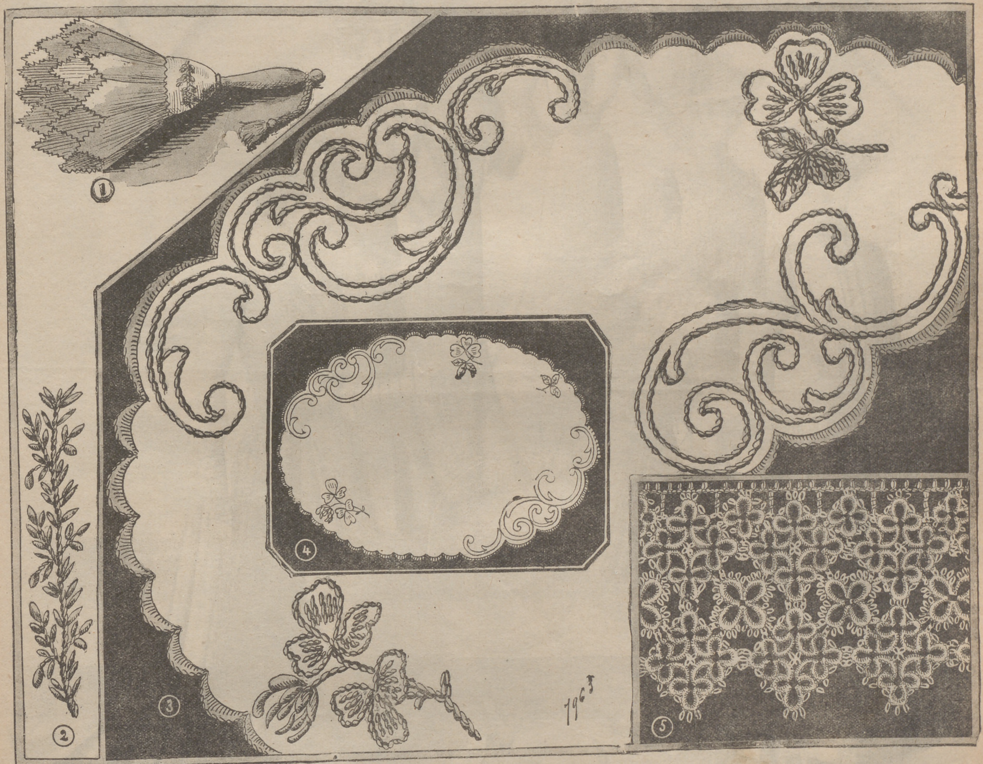
2. Limpia-plumas. — 3. Platillo de granité bordado para alcuza ó vinagreras. — 4. Rico encaje de frivolidé.

4. Rico encaje de frivolidé. Se ejecuta con dos lanzaderas del siguiente modo: estrellas de 4 tréboles compuestas así: 3 anillos de 3 nudos, 1 piquillo, 1 nudo, 3 piquillos, 1 nudo, 1 piquillo, 3 nudos; cerrar cada uno de estos 3 anillos enlazados unos a otros por medio de los primeros piquillos; tomar la segunda lanzadera y hacer cinco nudos, 1 piquillo, 5 nudos, repetir 4 veces este trabajo y hacer tantas estrellas en longitud y anchura como lo exijan las dimensiones del objeto que se debe guarnecer. Estrellitas de 4 anillos de 5 nudos, 8 piquillos, 5 nudos, llenan los huecos formados por la separación de las grandes estrellas. Para terminar, se hacen 2 hileras al crochet. Primera hilera: * 5 m. cadenetas, 1 punto en el piquillo central de un anillo; 5 m., 1 doble bar. en el hueco formado por las 2 estrellas, tomar de nuevo desde el signo *. Segunda hilera: bar. de 2 en 2 m. y separadas por 1 m. al aire. No se eche en olvido que los anillos se hacen siempre con la primera lanzadera y las presillas con la segunda. Este rico y lindo modelo es muy adecuado para guarnición de faldas, cuerpos, lencería de niños y labores de fantasia.