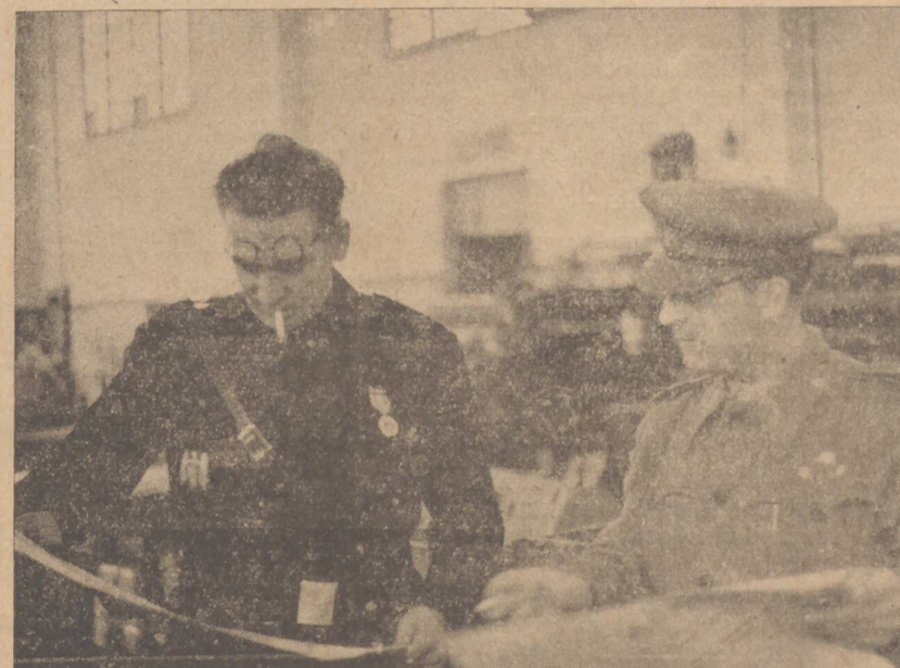
El Administrador General de la Prensa del Movimiento, y el Director de “FALANGE”, miran los primeros números de nuestra edición salidos de la máquina.