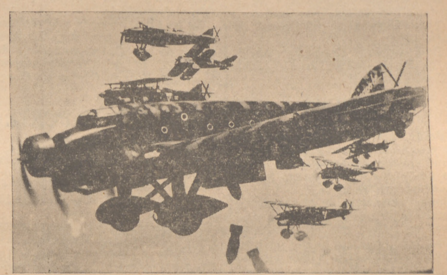
He aquí un hermosísimo recuerdo de nuestras alas triunfales. El "bombardeo" avanza arrojando su carga sobre las posiciones enemigas.