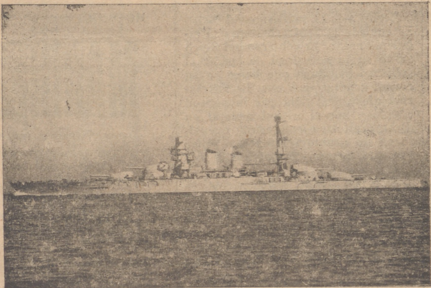
ACORAZADO «CAVOUR», BUQUE INSIGNIA