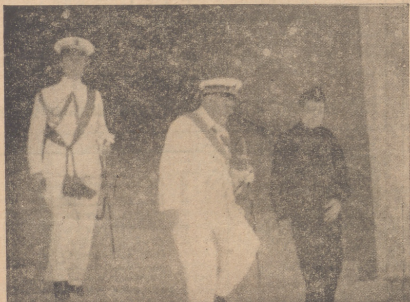
EL ALMIRANTE SALIENDO, EN COMPANIA DEL CONSUL, DE COMANDANCIA