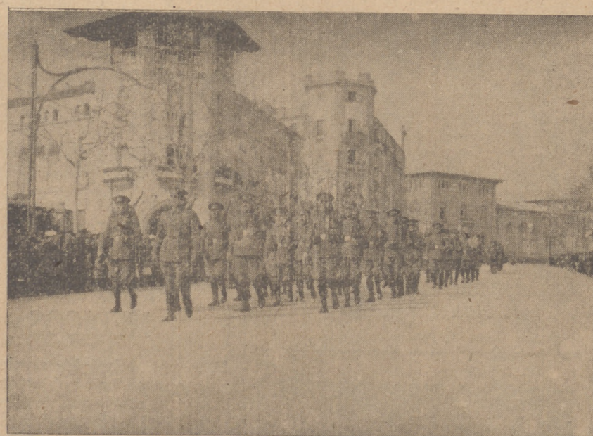
CON APLAUSOS Y VITORES FRENETICOS DESFILARON AYER NUESTROS SOLDADOS POR LA VIA ROMA. NUESTRO REPORTER CAPTO EN SU RETINA A LA SECCION DE CARABINEROS QUE LLAMO GRANDEMENTE LA ATENCION POR SU MARCIALIDAD Y CORRECCION