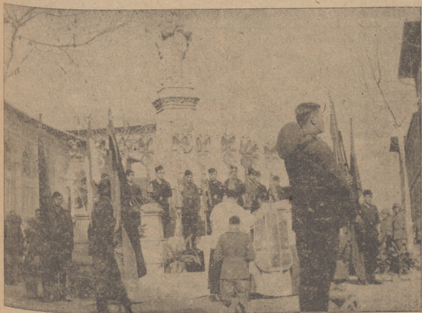
BAJO LA SOMBRA DEL GRAN RAMON LULL COLOCÓSE EL ALTAR RODEADO DE BANDERAS VICTORIOSAS Y LABAROS DE LA JEFATURA DE PROPAGANDA

Alemania conmemora el sexto aniversario del establecimiento de su tercer Reich