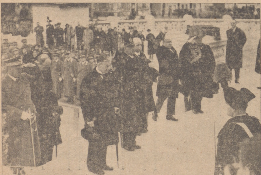
CHAMBERLAIN Y HALIFAX ANTE LA TUMBA DEL SOLDADO DESCONOCIDO

Chamberlain llegará a Londres el domingo a las 5'30 de la tarde.