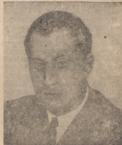
En sus lugares de costumbre estaban el Gobernador Civil, el Ayuntamiento de Palma presidido por el señor Alcalde de la Diputación Provincial con su Presidente.

Presidió el duelo el Jefe Provincial de Falange Española Tradicionalista y de las JONS., acompañado del Secre-