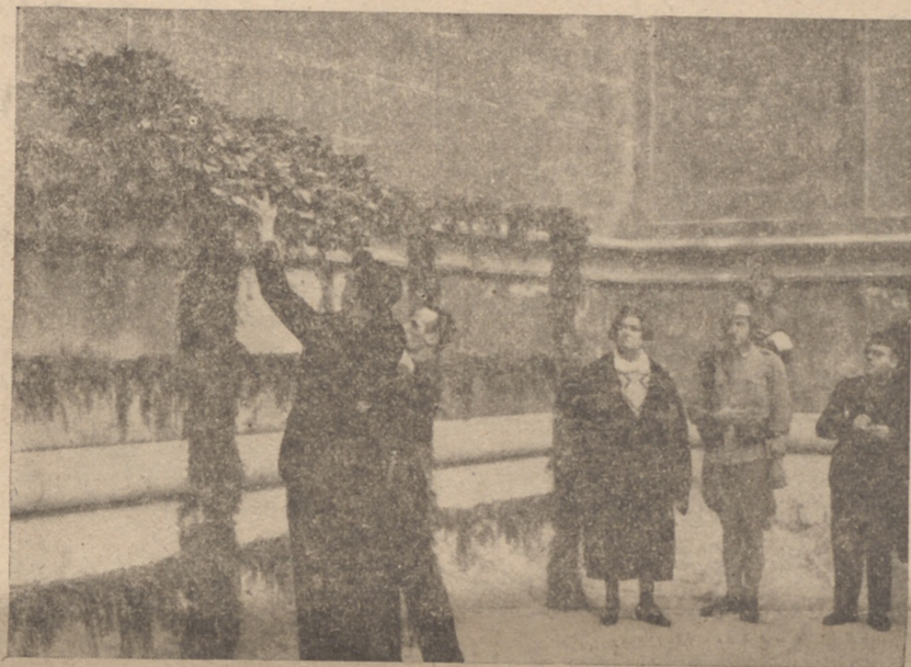
Como si el cielo quisiera juntarse al dolor de la tierra, que era dolor sin lágrimas ni histerismos, amaneció el día nublado, sin sol, triste. Los balcones del azul habían eulutado sus colgaduras.

Palma entera vibró en la jornada de ayer, que fué algo inenarrable por su seriedad y su misticismo. Las calles llenas de gentío que paralizaba sus conversaciones banales. Los comercios cerrados. Los balcones ostentando sobre sus colgaduras negros lazos de luto. El tránsito rodado paralizado. Y profusión de uniformes caquis y azules yendo a rendir tributo de homenaje a la eterna presencia de nuestro JOSE ANTONIO.