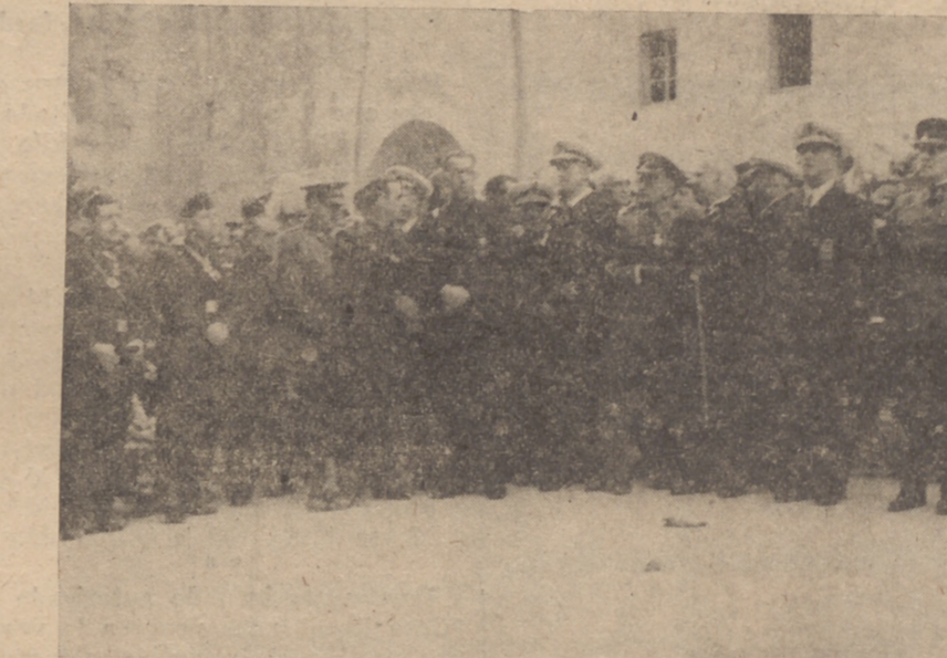
lería, dispuesta a disparar las salvas de ordenanza.

La Guardia de la Comandancia General, formada ante la presencia de las Autoridades y Jerarquías. Frente al Mirador con la cara hacia el Mediterráneo, una Batería de Arti-