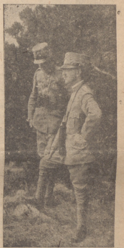
Y siempre inteligente colaboración con la obra del Duce.

La historia del Fascismo es — en uno de sus aspectos — el resultado de la íntima comprensión de Víctor Manuel III con Mussolini y de su leal