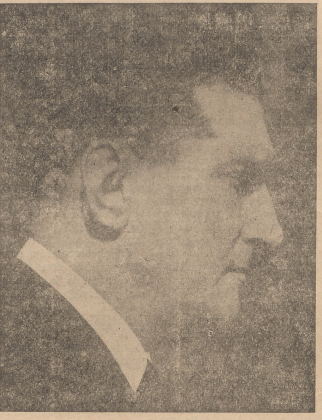
EXCMO. SR. OLIVEIRA SALAZAR, JEFE DEL GOBIERNO PORTUGUES

El material ferroviario quedó casi por completo destruido, y de entre sus restos se han extraído 60 muertos y más de un centenar de heridos.