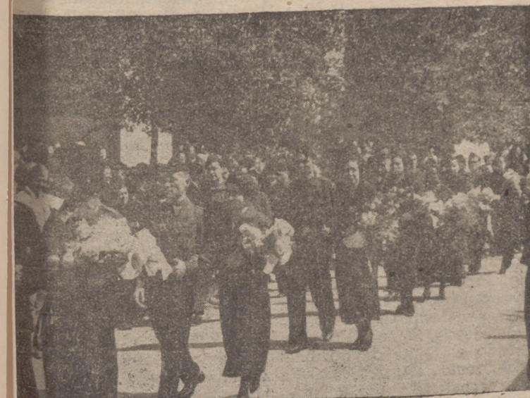
comitiva de novios dirigiéndose, entre el calor de los fervientes aplausos del público, a la Catedral.

Al llegar ante el altar, los novios van tomando sitio en los lugares prefijados. En ambos lados se ha-