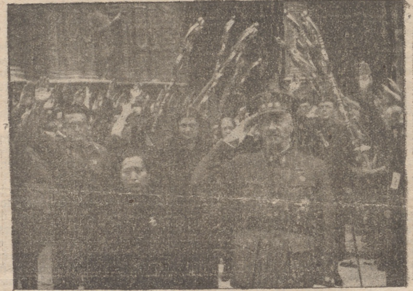
Nuestra primera autoridad Militar, el General Excmo. Señor Don Trinidad Benjumeda del Rey, con la madrina de las boas, nuestra camarada Catalina Sureda de Dezcallar saliendo de la Basílica después de celebrada la Misa.

El "España" chocó contra una mina a la deriva.—La formidable actividad de nuestra escuadra.