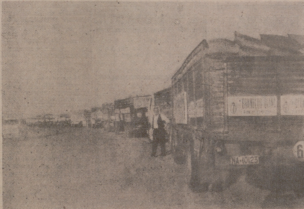
Los 25 camiones de Gránulos Diana, a punto de llegar a Logroño, por las carreteras navarras. Un momento de descanso para agrupar la caravana.