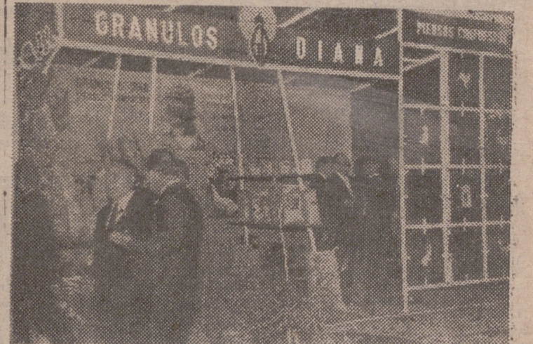
Este grabado recoge el momento inaugural de la VII Feria del Vino. Al fondo y en el stand de Gránulos Diana, el director general de Ganadería, el gobernador civil de Logroño y el jefe de la Unión Nacional de Cooperativas. En primer plano, el director general de Ganadería con otras autoridades.

ARNEDILLO Fonda y Café «MARRODAN» Los más próximos al Baleario Teléfono 4.