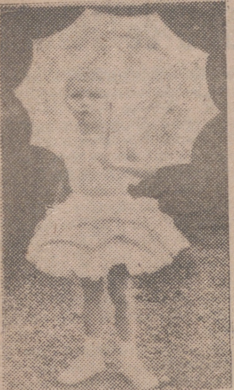
Modelo suizo para niña, en organdí bordado. Graciosa sombrilla del mismo tejido.