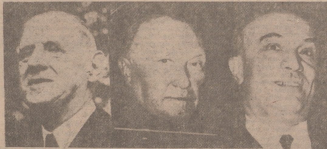
BAD-GODESBERG. -- En esta localidad alemana, famosa por otras reuniones internacionales de anteguerra, se celebrará la «conferencia cumbre» del Mercado Común. Los tres grandes, De Gaulle, Adenauer y Fanfani, representarán a sus respectivos países.