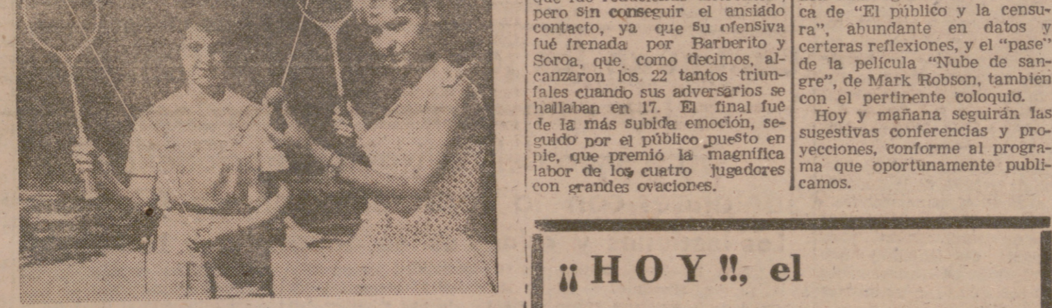
FRANCFORT. -- Estas dos señoritas muestran el nuevo deporte que empieza a ponerse de moda: el tenis sin contrincante. Una pelota unida a la raqueta por una goma. Lo demás es cuestión de práctica.