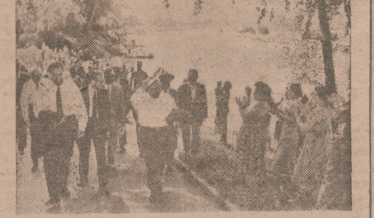
El vicepresidente de los EE. UU., Mr. Nixon, y el premier soviético, Krushev, en franca cordialidad, pasean por las orillas del Moskova. Con la ola de calor se despojaron de sus chaquetas y anduvieron entre las aclamaciones del público.

partido comunista polaco, Gomulka, que tiene por costumbre no acudir a ninguna de las ceremonias que se celebran en las embajadas norteamericanas. Una hora antes de que empezase la fiesta, la Policía acordó el edificio y cerró y ocupó todas las calles próximas, impidiendo el paso a todo aquel que no fuera miembro de la Embajada o del Gobierno de la nación.—(Efe). CORDIALES PALABRAS BERLIN, 4.—Informan desde Varsovia que durante la recepción ofrecida por el vicepresidente de los Estados Unidos, Richard M. Nixon, en la Embajada estadounidense, el hombre de Estado norteamericano manifestó que había "visto dos días muy interesantes en Polonia". "Nosotros somos miembros del mundo socialista y aliados de la Unión Soviética, y a pesar de esto, deseamos preservar al mundo de los peligros de otra guerra. Deseamos salvar a Europa y protegernos a nosotros mismos contra el peligro del resurgimiento del militarismo alemán". Acto seguido, Cyrankiewicz estrechó contra un árbol la copa con la que acababa de brindar por la paz en compañía de Nixon.—(Efe).