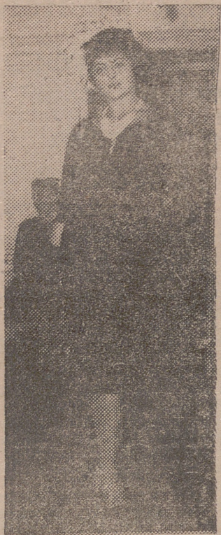
Gracioso traje de cocktail de doble punto. La manga japonesa y el escote ovalado muestran claramente el nuevo gusto en estas líneas. El rico collar de perlas da idea clara del gusto en bisutería. Modelo Moline Duvak.