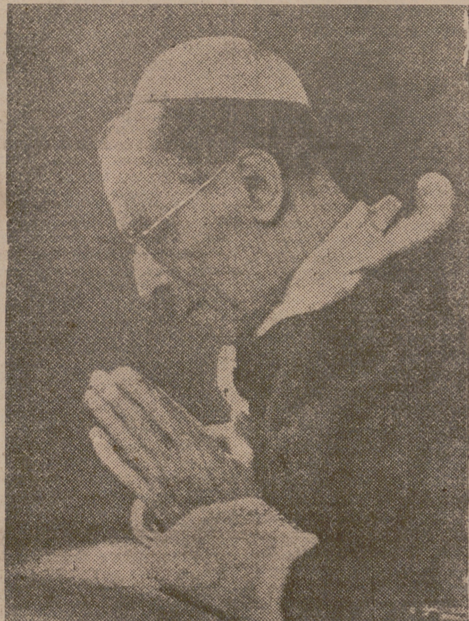
(Una de las últimas fotografías de S. S. el Papa, Pío XII, obtenida cuando el Santo Padre se encontraba orando.)