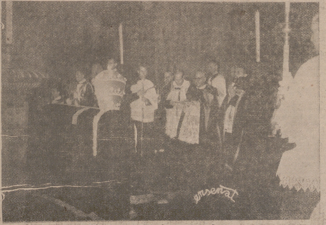
Un aspecto del presbiterio de la Colegiata de la Redonda durante el solemne funeral pontifical celebrado ayer en sufragio de S. S. Pío XII.