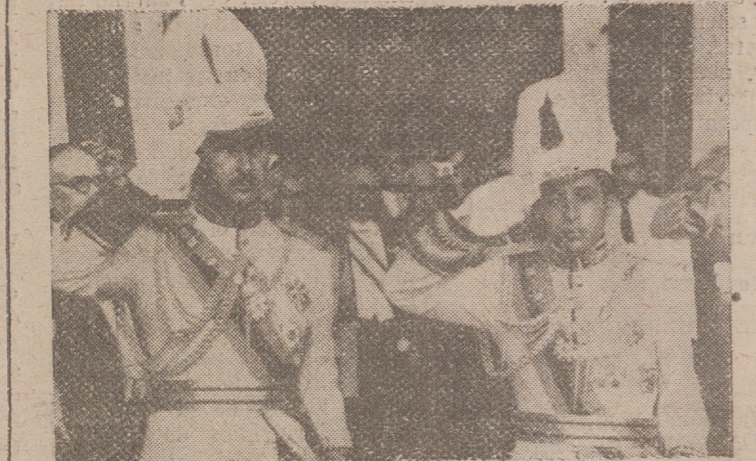
En la revuelta del Irak se asegura que el rey Faisal, de 22 años, y el príncipe regente, Abdul Illah, hijo del rey, han sido asesinados y sus cuerpos quemados en las calles. En la foto, el príncipe y el rey durante una reciente recepción.

Ha fallecido Henry Farman PARIS, 18.—Henry Farman, adelantado de la Aviación francesa, ha fallecido en París a los ochenta y cuatro años de edad.—(Efe.)