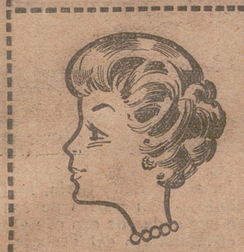
Una cabellera de espantapájaros

...¿ un atractivo peinado? La solución es muy simple Vitalice y embellezca sus cabellos con