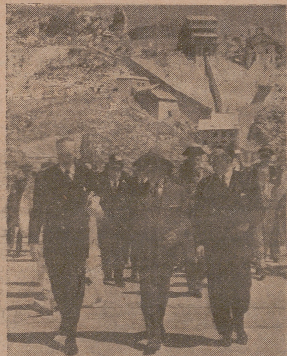
GUADALAJARA. --- Su Excelencia el Jefe del Estado, con los ministros y personalidades de su séquito y las autoridades provinciales, a su llegada al Pantano de Entrepeñas. --- (Foto Cifra).