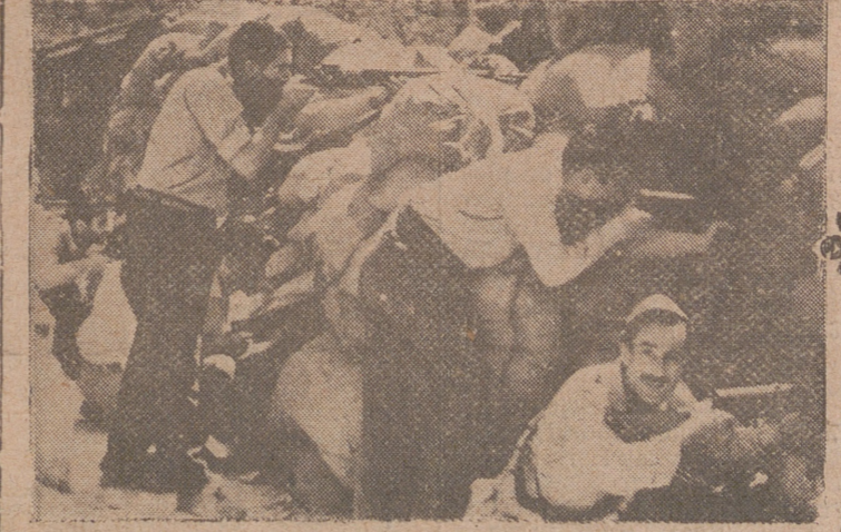
Mientras continúan las luchas en Beirut, los revolucionarios se preparan para lanzar su último ataque con el fin de capturar la capital del Líbano. En la foto, revolucionarios luchando en carreteras bloqueadas en Beirut. —.

SE REUNE EL CONSEJO PERMANENTE DE LA OTAN PARIS (Urgente), 15. — El Consejo Permanente de la OTAN se ha reunido a la una de esta tarde, bajo la presidencia del secretario general de la Organización, Paul Henri Spaak, con el fin de discutir la situación en el Oriente Medio. — (Efe.) CONVERSACIONES SOBRE POSIBLE INTERVENCIÓN FRANCESA PARIS, 15. — El general Charles de Gaulle ha convocado a sus principales consejeros diplomáticos y militares con el fin de celebrar urgentes conversaciones sobre una posible intervención francesa en las crisis libanesa e iraquí. La posibilidad de una acción