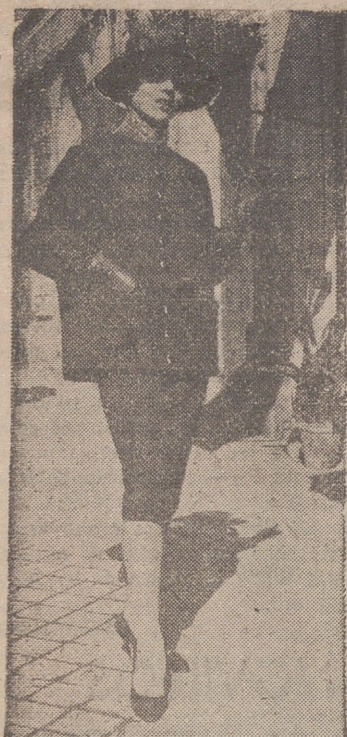
Traje de chaqueta semi-fantasia, con manga japonesa; completan el conjunto el sombrero de paja y el pañuelo de color beige y blanco.

EXCLUSIVAS NYLON Y PLASTICO OLGA Portabillos, 13 Telf 1295