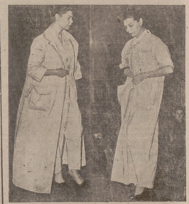
DESFILE EN BLANCO.—Reproducimos dos instantáneas de la emisión cara al público "Hogar", de Radio Nacional de España en Barcelona, durante la cual tuvo lugar este original desfile de prendas confeccionadas en algodón: camisones, pijamas, batas, etc. Ante un fondo de público interesado en el desfile, la modelo pasa dos bellos conjuntos en algodón: un pijama con una bata del mismo tejido y otra bata tirada, y pequeños cuadrillos, cómoda y duradera.