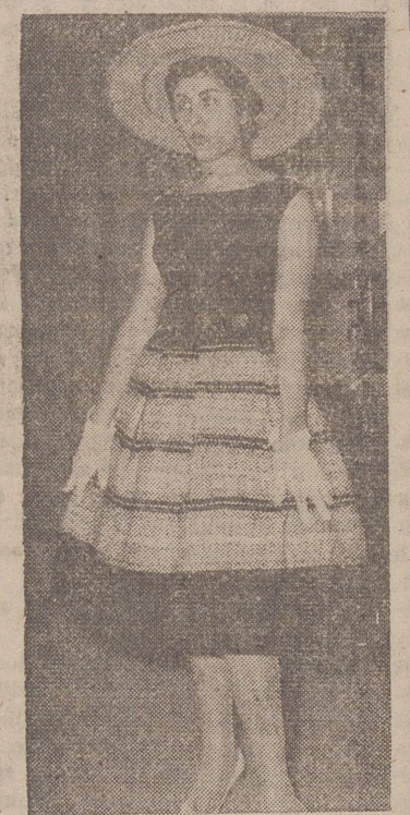
Jovial conjunto de verano. Cuerpo negro y falda blanca, negra, amarilla y encarnada. Como nota original de este conjunto adviértase el tejido de la falda imitando paja.

ticular, su influencia llega hasta los modelos de confección. Para 1958 ha lanzado dos tipos de silueta: la mujer-niña y la mujer-fatal. La primera viste con falda corta, talle alto, y escote prudente... y la segunda descubre su rodilla al draparse el bajo y viste