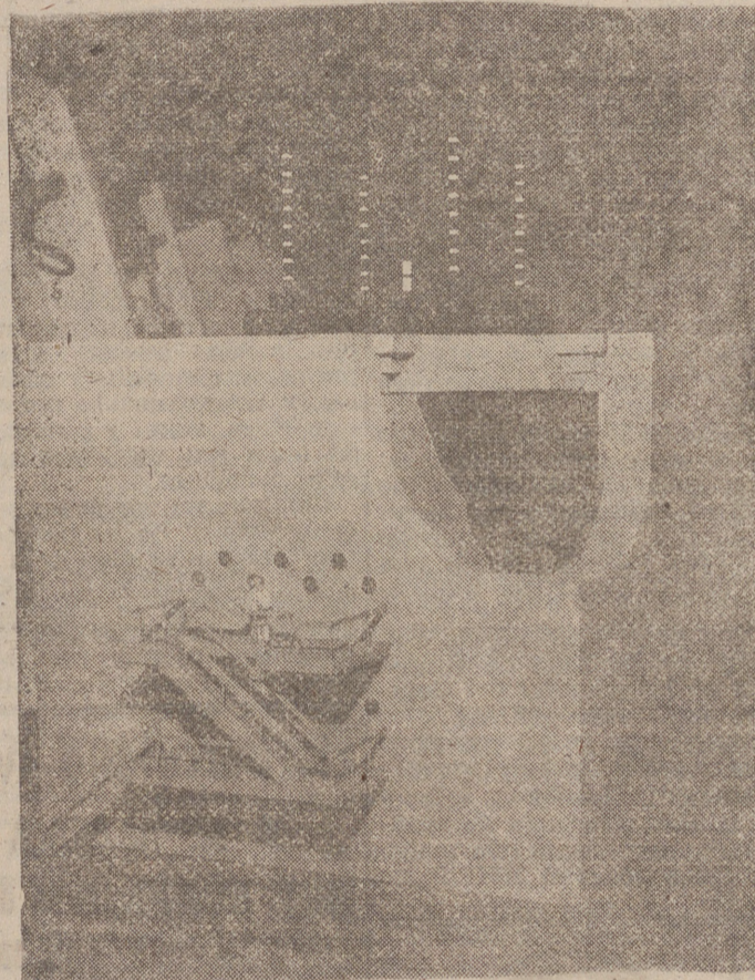
Maqueta de una pila atómica. Las gruesas paredes sirven para aislar de las radiaciones y las barras de grafito para moderar la reacción...