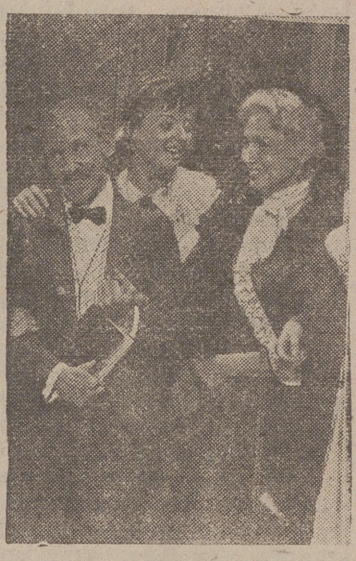
Una escena de la película (aún sin estrenar) «Las de Caim», basada en la obra de los Hermanos Alvarez Quintero y donde la señora Pla incorpora el simpático papel de la madreita

de volante alrededor de los hombros, rematado a su vez por hilos dorados. El tocado, a base de plumas blancas.